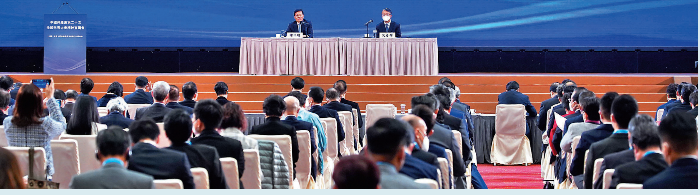
◆香港特區政府昨日在香港會議展覽中心舉行中共二十大精神宣講會，全國人大常委會法制工作委員會主任沈春耀（右）和全國政協經濟委員會副主任謝伏瞻（左）出席作宣講。

應特區請求，中央宣講團來港講解中國共產黨第二十次全國代表大會精神。特區政府昨日在灣仔香港會議展覽中心舉行兩場中共二十大精神宣講會。宣講團成員、全國人大常委會法制工作委員會主任沈春耀在宣講會上表示，二十大報告表明「一國兩制」是最佳制度安排，要長期堅持和全面準確。長期堅持制度，必然會遇上需要與時俱進的問題，因此要不斷完善，否則很容易失去生機和活力。他並強調，二十大報告其中一個重要內容，是香港須堅持行政主導而不是「三權鼎立」。