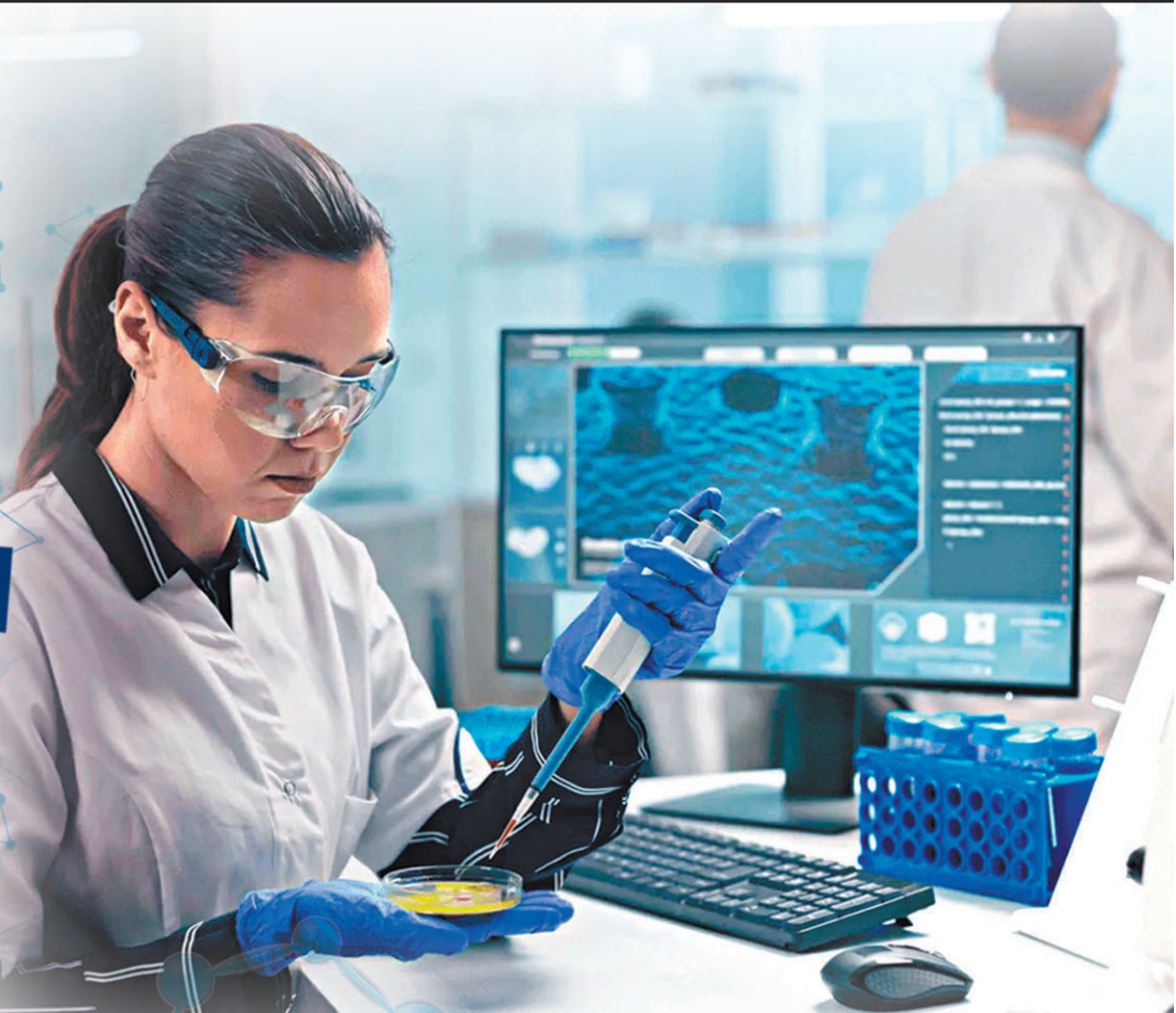
◆ AI製藥成近年藥物研究新方向，歐美投資者紛紛加大投資。

利用人工智能(AI)技術研發新藥，成為近年藥物研究的新方向之一。美國科企Google母公司Alphabet名下的藥企Isomorphic Labs，正積極開發有關技術，據報該企業已與數間知名藥廠磋商，最快未來數月達成首宗「AI製藥」交易。分析認為AI製藥將掀起一場「新藥革命」，能更好利用數據分析，為多種疾病提供全新療法。不過也有聲音指任何藥物從研發到臨床使用都相當耗時，AI製藥前景仍有待觀望。