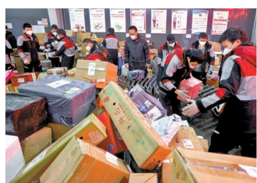
◆12月5日，國家郵政局發布，全國快遞日均業務量連續穩步上漲，12月2日至4日，連續三天日均超3億件，實現了迅速反彈。圖為北京西城區快遞員分揀快遞。

當前，快遞業仍處於旺季，在即將到來的「雙12」和年貨節等促銷活動的推動下，快遞業務量有望持續增長。