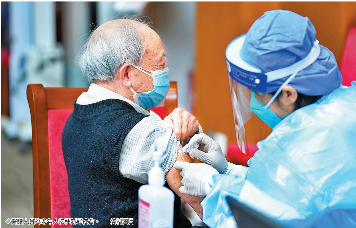
◆醫護人員為老年人接種新冠疫苗。 資料圖片

這款疫苗的三期臨床試驗是全球第一個黏膜免疫新冠疫苗的隨機對照保護效力試驗，在菲律賓、南非、越南和哥倫比亞等國共有31,038名18-91歲志願者參與其中。臨床試驗數據顯示，無論作為基礎免疫還是序貫加強免疫，鼻噴疫苗對奧密克