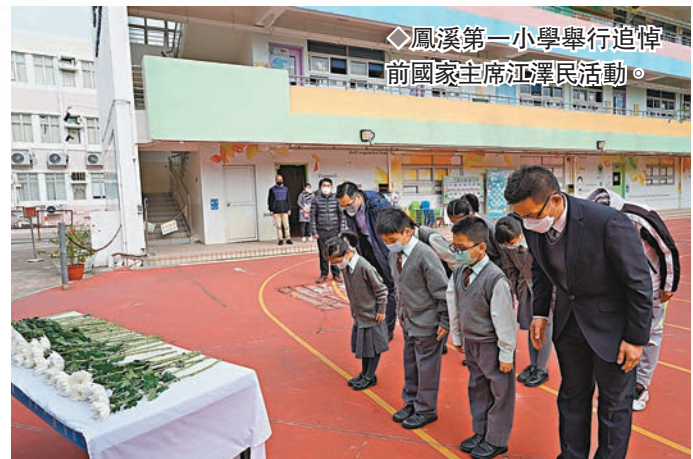
◆鳳溪第一小學舉行追悼前國家主席江澤民活動。