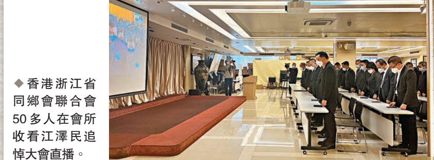
◆香港浙江省同鄉會聯合會50多人在會所收看江澤民追悼大會直播。