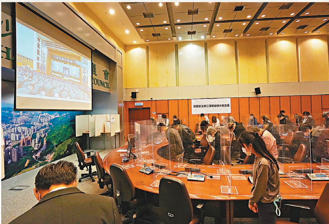
◆香港18個區的民政事務處於指定地點安排直播追悼大會。