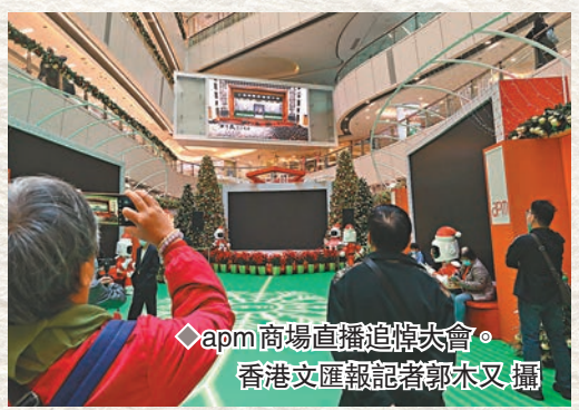
◆apm商場直播追悼大會。

另外，在香港網民製作的弔唁江澤民網站上，許多市民留言寄託哀思。一條條「江爺爺走好」「我們永遠懷念您」，抒發香港市民對江澤民的感情。連日來，已有逾25萬名市民在弔唁網站獻花、留言寄託哀思。