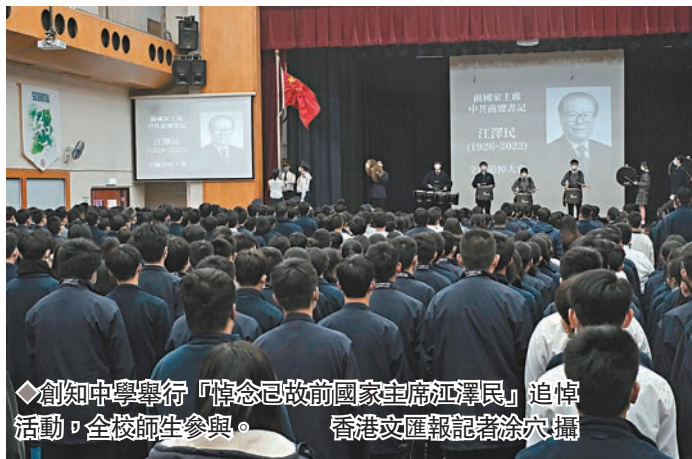
◆創知中學舉行「悼念已故前國家主席江澤民」追悼活動，全校師生參與。