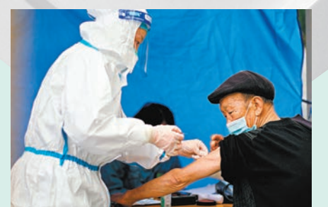
◆12月7日，重慶渝北區，一位老年人在接種新冠病毒疫苗。

針對長期病患者的擔憂，鄭忠偉也明確回應，糖尿病、高血壓等慢性病不是新冠病毒疫苗接種的絕對禁忌，只要這些慢性病控制得好，處於穩定期，都可以接種新冠病毒疫苗。鄭忠偉說，在官方下發的加快推進老年人新冠病毒疫苗接種的方案裏，也確定了4種不能或者暫緩接種的一些情況，「對於老年人來