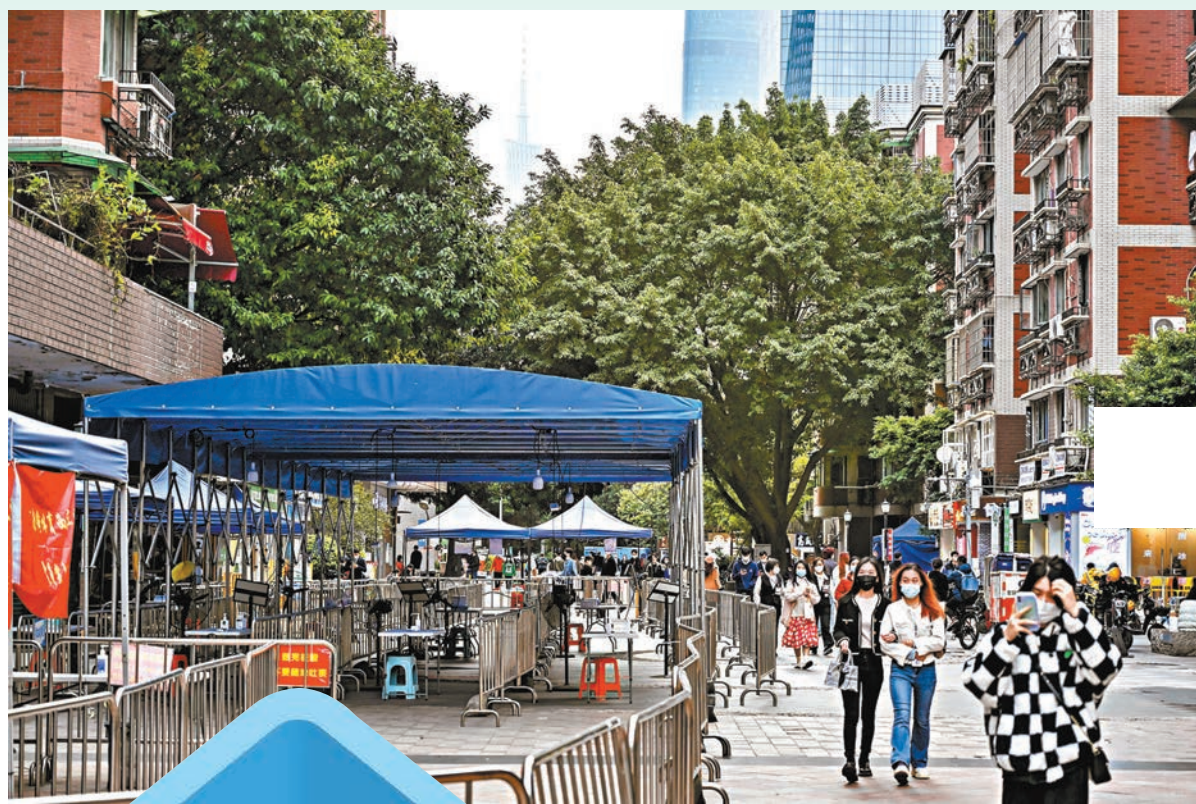
◆「新十條」規定不按行政區域開展全員核酸檢測。圖為廣州天河一核酸採樣點近日停用，街上人氣有序恢復。

內地優化防控措施「小步快走」再有進展。國務院聯防聯控機制7日發布《關於進一步優化落實新冠肺炎疫情防控措施的通知》（下稱「新十條」），明確內地無症狀感染者和輕型病例一般採取居家隔離；不再對跨地區流動人員查驗核酸檢測陰性證明和健康碼，不再開展落地檢；不得採取各種形式的臨時封控等。「這次的優化並不是完全放開不防」，國家衛健委疫情應對處置工作領導小組專家組組長梁萬年昨日就此表示，這是主動優化而不是被動的，優化措施將更好適應疫情防控的新形勢和新冠病毒變異株的新特點，進一步提高疫情防控的科學性和精準性，使防控更具可操作性和針對性。國家衛健委強調，不斷優化完善防控措施，將逐步加快推進入境人員管理等外防輸入措施的優化完善。