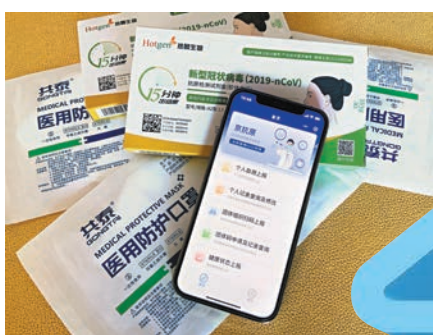
◆「京抗原」小程序近日上線，北京市民可在該小程序上自行上傳檢測結果。 中新社

按照國家衛健委對於感染者的分級定義，「無症狀感染者」是指新冠病毒病原學檢測呈陽性但無相關臨床表現者。