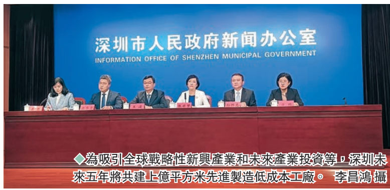
◆為吸引全球戰略性新興產業和未來產業投資等，深圳未來五年將共建上億平方米先進製造低成本工廠。

為響應中共二十大報告提出的高質量發展號召，確保好企業、好項目落戶深圳，深圳市昨日在一個新聞發布會上透露，未來5年裏深圳將每年建設不少於2,000萬平方米的高品質、低成本、定製化廠房空間。換言之，未來5年將共建上億平方米先進製造低成本工廠。有關專家表示，深圳大面積低成本先進製造工廠將可以吸引香港及海內外科技創新企業躍躍入駐。 ◆香港文匯報記者 李昌鴻 深圳報道