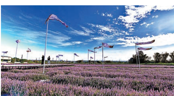
現場以仙草花打造5公頃紫色的花海仙境。