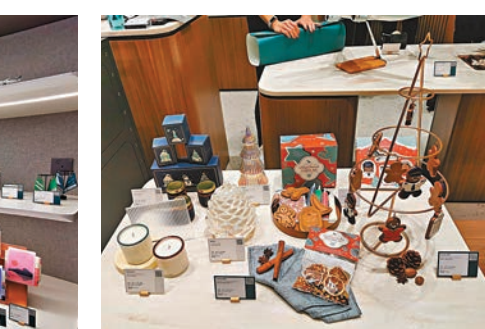
國泰聖誕主題產品