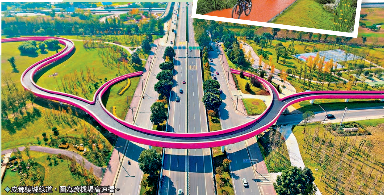
成都繞城綠道，圖為跨機場高速橋。