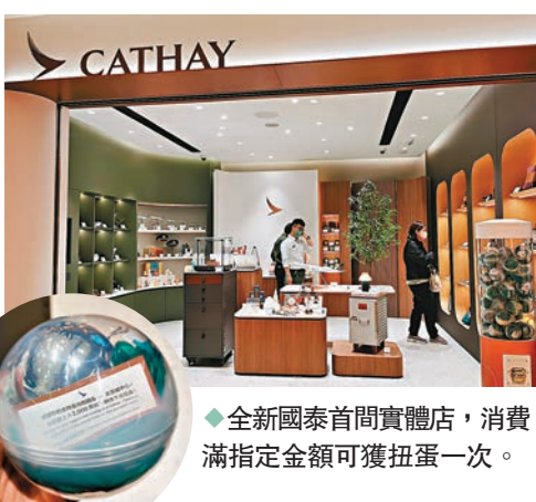
全新國泰首間實體店，消費滿指定金額可獲扭蛋一次。

親臨實體店的顧客可以盡情選購一系列國泰品牌商品，如國泰×Start From Zero特別版升級再造備餐間收納箱，以及國泰聖誕主題產