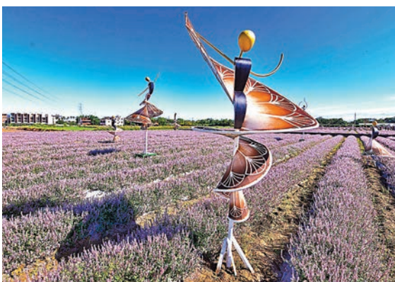
「2022桃園仙草花節」現正在楊梅休閒農業區舉行。