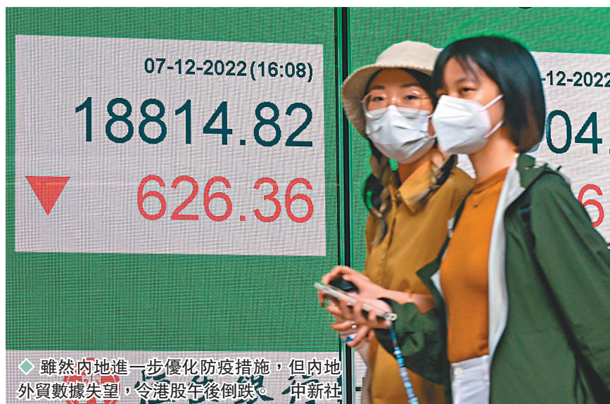
◆雖然內地進一步優化防疫措施，但內地外貿數據失望，令港股午後倒跌。中新社