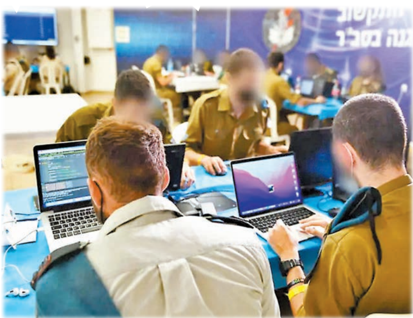
◆美緝毒局被揭使用Paragon研發的間諜軟件，該公司由圖示的以軍8200部隊前指揮官創立。