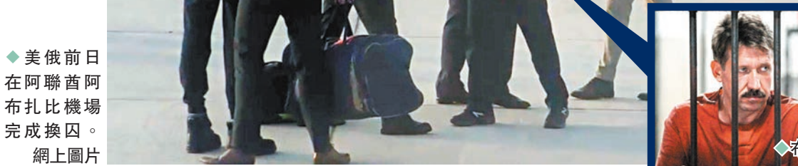
◆美俄前日在阿聯酋阿布扎比機場完成換囚。

美國和俄羅斯前日在阿聯酋阿布扎比機場完成換囚，美國釋放俄軍火商布特，換取俄方釋放著名美國女子籃球運動員格里納。美國共和黨人士批評這次換囚對俄有利，形容是「送給（俄總統）普京的禮物」。然而目前因間諜罪被俄關押的美國海軍陸戰隊前成員惠蘭卻不獲交換，他對此感到失望，也引起輿論質疑因格里納知名度高而受到廣泛關注，故此獲美方優先交換。