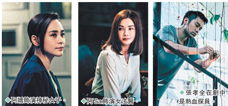
◆阿嬌飾演神秘女子。