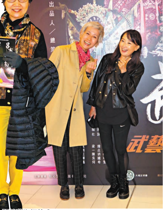
◆張德蘭攜攜韓式愛心手勢。

些手鐲和頸鏈等金器送給孫女。有傳授生產心得給新抱；她笑指自己出過育兒書，已經給了兒子和新抱看，但最重要是新抱保持開心心情和吃好一点不要太緊張，所以她也為新抱準備了山珍海味讓她補身。 葉童作為藝術工作者，但凡表演她也會欣賞，尤其粵劇演出場數不多，每次也不夠，戲迷爭搶不到門票。以前她都有做過古裝的舞台劇，又有參與粵劇？她笑說：「這方面對我有些遙遠，如果有班主賞識我都可以試下，但粵劇真的要花好多功夫及時間才可以上台演出，以前我試過化大戲妝拍戲，但只拍了一日個頭已經赤痛到不得了，因為個頭飾好重，還要邊唱邊演戲，所付出的體能及精神好大，我又不是科班出身，臨時伸隻腳入來，雖然觀眾會體諒，但自己會不好意思。」至於有何新動向？葉童表示之前為一部新導演拍的電影客串了一角，最近亦有演出接洽中，只不過疫情關係，仍有待落實，不過這段期間她都有在演藝上增值自己，希望未來觀眾看她演出再有驚喜。