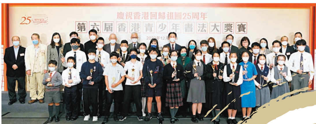
「第六屆香港青少年書法大獎賽」昨日舉行頒獎典禮，獲獎學生與嘉賓合照。

作品中，感知到愈來愈多香港青少年的扎實臨帖基礎，不僅寫出了字字珠璣、鏗鏘有力的氣勢，亦有字字聯綴、一氣呵成的韻律，更有因字賦形、隨字而安的姿態。他引述有評委表示，這是當代香港青少年「用火熱的青春書寫精彩人生」的象徵，從中看到了中華優秀傳統文化藝術傳承的新希望。