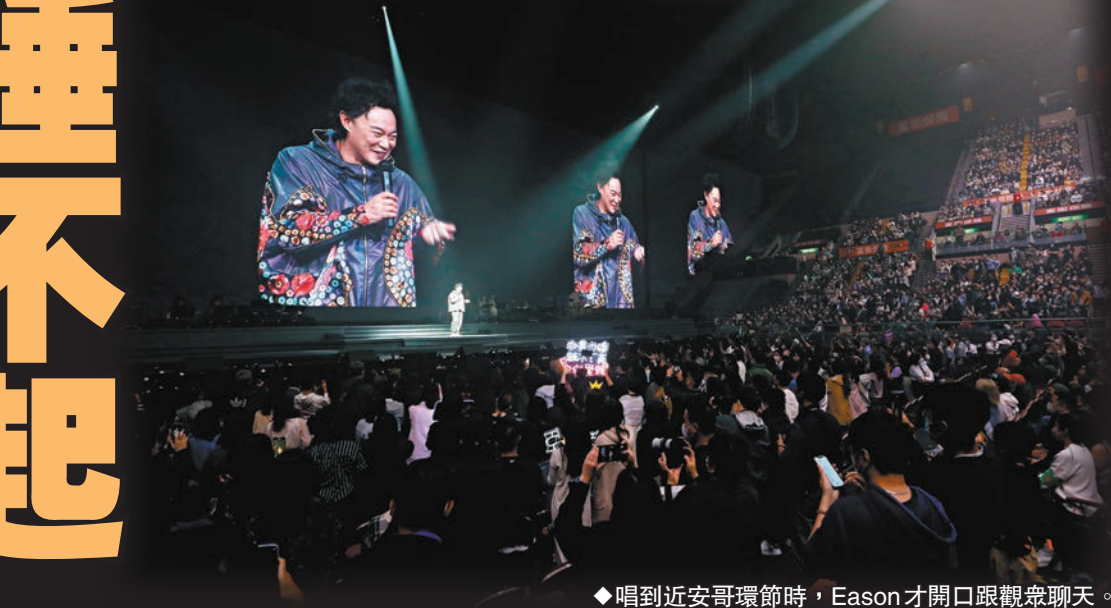
◆唱到近安哥環節時，Eason才開口跟觀眾聊天。

個唱創下紅館史上最巨大電子屏幕紀錄的Eason，序幕睡在床上開始，畫面見他惡夢中被各種爬蟲走進體內，驚醒後的他在掙扎躲避之下竟然跌進床下的無底深淵之中，並飛上了太空。換上太空人裝扮的Eason與舞蹈員載歌載舞，並以一曲《人神鬥》警醒大家要愛護地球，反思環保和珍惜萬物。其後場景轉換成世界崩壞後的世界，Eason選唱《當這地球沒有花》、《謊言》、《時代巨輪》等歌曲，其間出場的大頭木偶公仔、戴着古代黑死病面罩的舞蹈員現身，示意身處時代巨輪之中，無人能逃脫的悲歌，最後只得躲進逃避現實的世界。