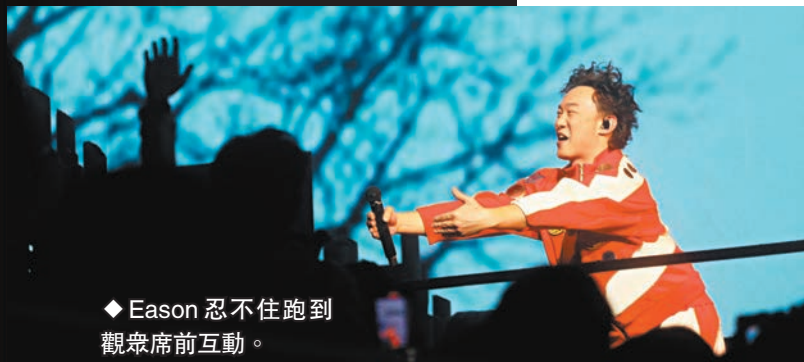
◆Eason忍不住跑到觀眾席前互動。