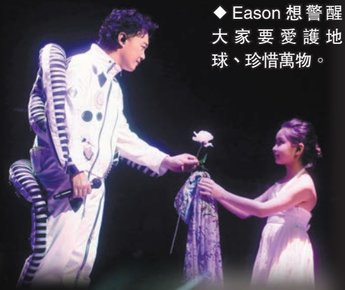
◆Eason想提醒大家要愛護地球、珍惜萬物。

香港文匯報訊（記者 達里）一連 25 場的陳奕迅（Eason）《Fear and Dreams》演唱會前晚於紅館順利舉行，相隔 9 年再度踏上紅館，Eason 將他 3 年前已構思的理念展現給歌迷欣賞，演唱會有別過往他的演出和「吹神」愛講說話的性格，真正做到以歌會友。唱到近安哥環節時，Eason 才開口跟觀眾聊天，脫下耳機感受到現場歡呼聲的他，直言很想錫勻每一位觀眾。