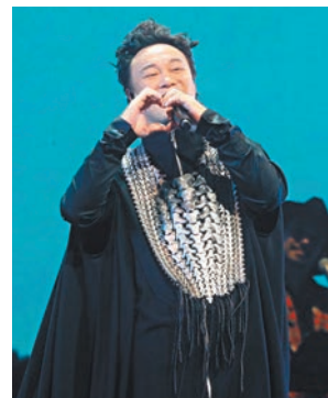
◆Eason以雙手做出心形手勢回應觀眾。

香港文匯報訊（記者 達里）一連 25 場的陳奕迅（Eason）《Fear and Dreams》演唱會前晚於紅館順利舉行，相隔 9 年再度踏上紅館，Eason 將他 3 年前已構思的理念展現給歌迷欣賞，演唱會有別過往他的演出和「吹神」愛講說話的性格，真正做到以歌會友。唱到近安哥環節時，Eason 才開口跟觀眾聊天，脫下耳機感受到現場歡呼聲的他，直言很想錫勻每一位觀眾。