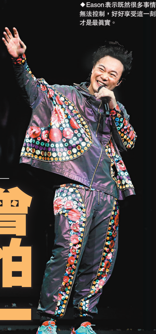
◆Eason表示既然很多事情無法控制，好好享受這一刻才是最真實。