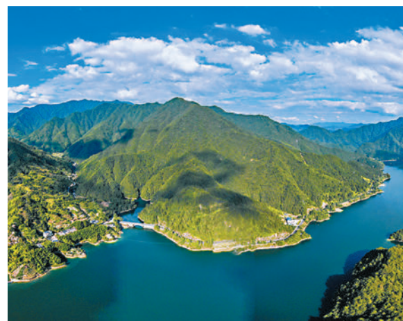
◆錢江源國家公園體制試點區的蓮花湖景觀。

世界自然保護聯盟綠色名錄是一項旨在成功保護自然的全球運動，會根據全球適用的嚴格標準對「管理有效、治理公平、對人類和自然產生長期積極影響」的自然保護地進行認證。