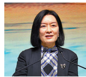
◆盧新寧致辭。

香港文匯報訊（記者 姬文風）香港中聯辦副主任盧新寧昨日出席「創科博覽2022」開幕禮並致辭，分享關於香港創科發展的三點體會，包括要堅定創新自信，鞏固提升香港創新科技的優勢和地位；把握戰略機遇，加快建設國際創科中心，以及提升創科活力，打造香港創科發展最優生態。