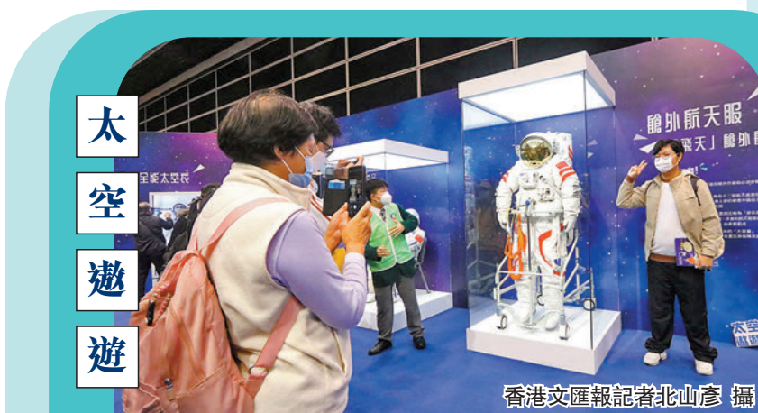
太 空 遨 遊