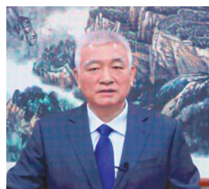
◆王志剛視像致辭。

香港文匯報訊（記者 姬文風）昨日在「創科博覽2022」開幕禮上，國家科技部部長王志剛透過視像致辭時表示，經中央政府批准同意，科技部與特區政府將於近日正式續簽《內地與香港關於加快建設香港國際科技創新中心的安排》。科技部將在中央對港工作方針的指引下，推動內地和香港科技界攜手並進，繼往開來，充分發揮香港獨特的科技創新優勢，深入推進香港「一國兩制」實踐，為加快科技自立自強，建設科技強國作出新的、更大的貢獻。