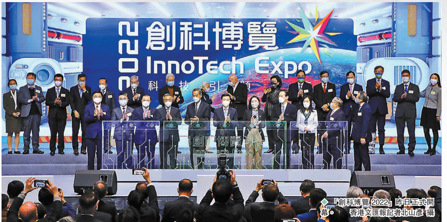
◆「創科博覽2022」昨日正式開幕。