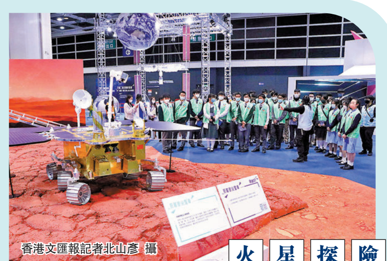
火 星 探 險