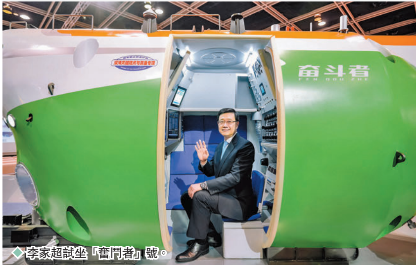
◆李家超試坐「奮鬥者」號。

由團結香港基金主辦、國家科技部支持和中國科學技術交流中心協辦的「創科博覽2022」昨日上午舉行開幕典禮，全國政協副主席梁振英、香港特區行政長官李家超、中聯辦副主任盧新寧、外交部駐港公署副特派員楊義瑞、團結香港基金常務副主席陳智思任主禮嘉賓。李家超致辭時指，今次博覽的主題展區當中，除了展示一般香港市民比較少機會接觸到的國家深海科技和陸地科技，更包括最近大家特別關注的航天科技，介紹中國載人航天工程、月球和火星探測工程等專項，讓市民可以近距離欣賞到難得一見的国家大型科技項目，了解國家的創科發展對未來世界和人類文明的貢獻。他特別提到，特區政府正積極配合國家進行選拔載荷專家的初選工作，預計今個月內就會把推薦名單上報國家。