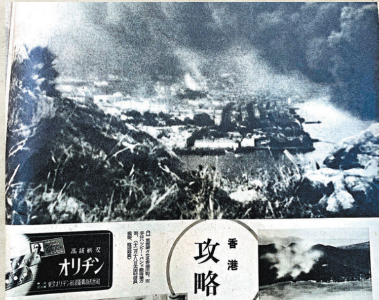
◆《朝日畫報（新春特別號）》中一張標註拍攝日期為1941年12月18日的照片中，俯視視角下的香港島黑煙滾滾。