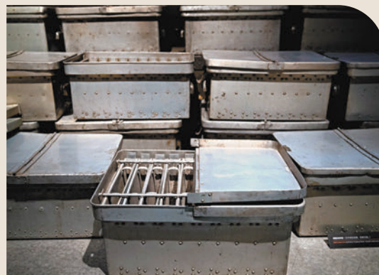
◆這是在侵華日軍第七三一部隊罪證陳列館內展出的細菌培養箱。

731部隊是二戰期間侵華日軍以研究防治疾病和飲水淨化為名，實則用中國人、朝鮮人、蘇聯