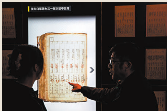
◆12月10日，工作人員在介紹新展出的《關東軍防疫給水部留守名簿》。

歷經30餘年艱辛尋證和不懈研究，侵華日軍第七三一部隊罪證陳列館已擁有七大類近10萬件館藏罪證文物及史料，構成了相互印證、真實完整的立體