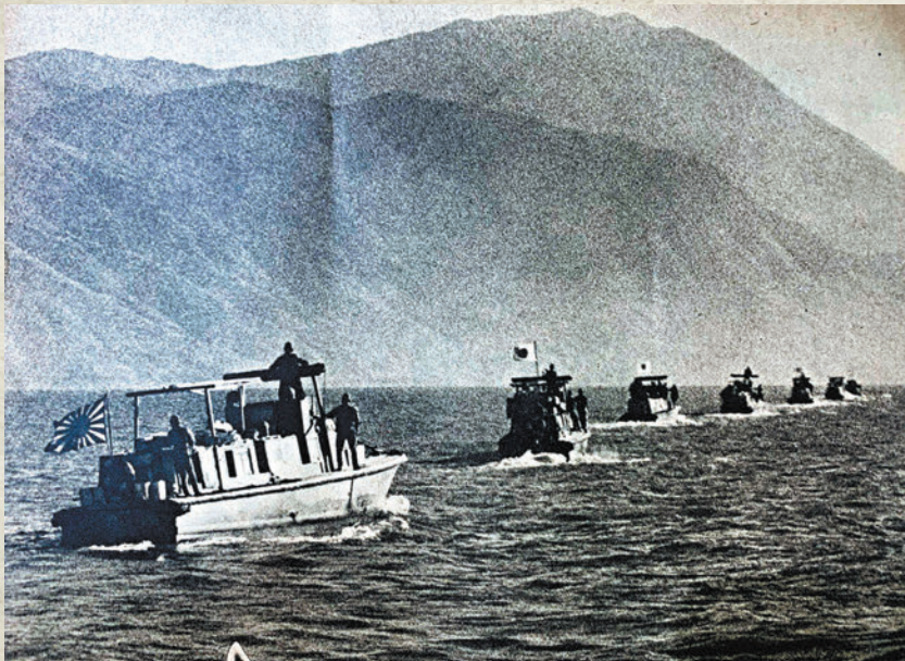
◆《朝日畫報（新春特別號）》中一張拍攝於1941年12月17日的照片。5艘日軍艦艇整齊航行在香港水域，為侵略香港島做戰前準備。