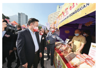
◆香港東莞社團總會攤位。