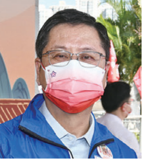
◆黃俊康期望能夠讓更多青年人帶隊，參與其中。