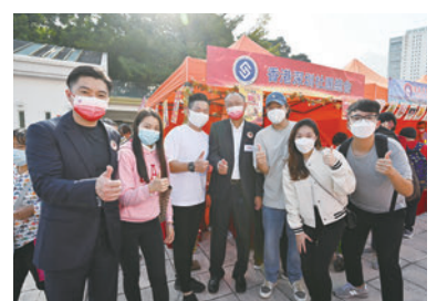
◆香港深圳社團總會攤位。