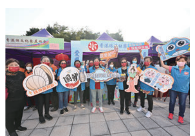
◆香港韶關同鄉聯誼總會攤位。