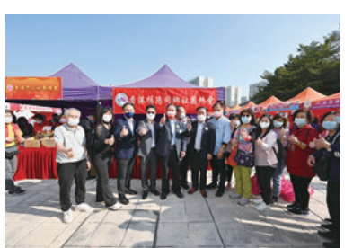
◆香港五邑總會攤位。