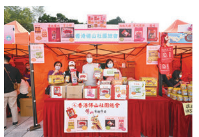
◆香港佛山社團總會攤位。