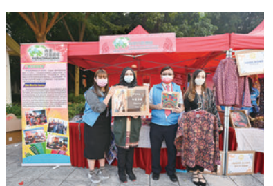
◆中華微創及外科醫生（香港）協會攤位。