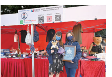
◆香港警察禮品商攤位。