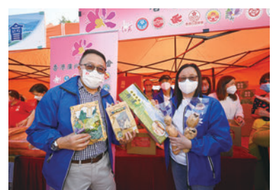
◆香港廣州社團總會攤位。