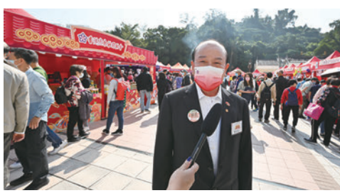
◆香港廣東社團總會攤位。