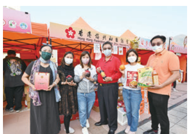
◆香港梅州社團總會攤位。