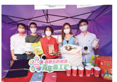
◆香港湛江社團總會攤位。