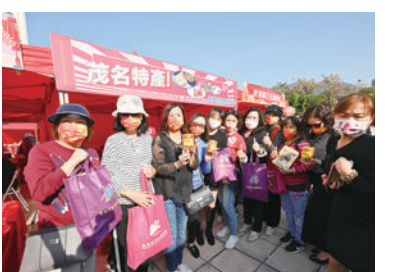
◆香港茂名同鄉總會攤位。