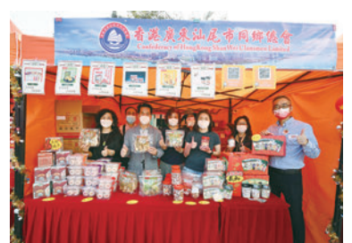
◆香港廣東汕尾市同鄉總會攤位。