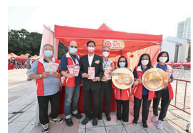
◆工聯會屯門地區服務處攤位。