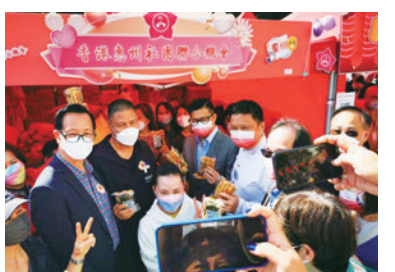
◆香港惠州社團聯合總會攤位。