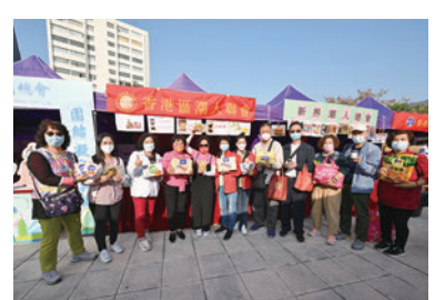
◆新界東潮人聯會攤位。