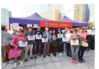
◆香港雲浮社團聯合總會攤位。