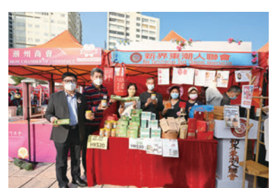
◆香港惠民服務社攤位。