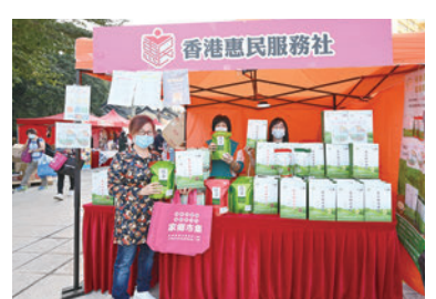
◆香港社區網絡攤位。