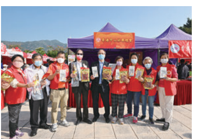
◆香港中山社團總會攤位。