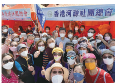
◆香港河源社團總會攤位。