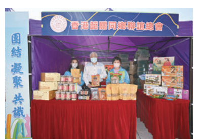
◆香港汕頭社團總會攤位。