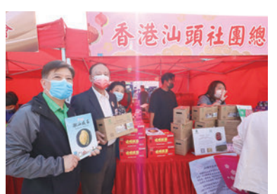
◆香港揭陽同鄉社團總會攤位。