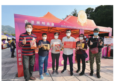
◆香港汕頭商會攤位。