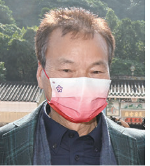
◆張國榮表示，「家鄉市集」做到實事、做到好事。