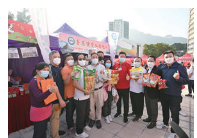
◆香港清遠社團總會攤位。