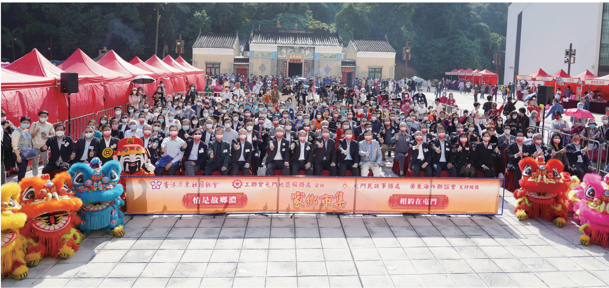
◆香港廣東社團總會（廣總）與工聯會屯門地區服務處合辦的第二屆「家鄉市集」——情是故鄉濃 相約在屯門，於屯門區天后廟廣場舉行啟動禮，賓主大合照。