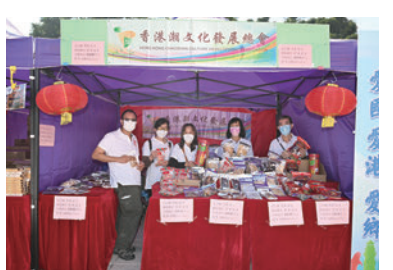
◆香港潮州商會攤位。