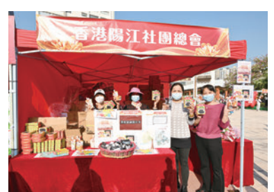
◆香港珠海社團總會攤位。