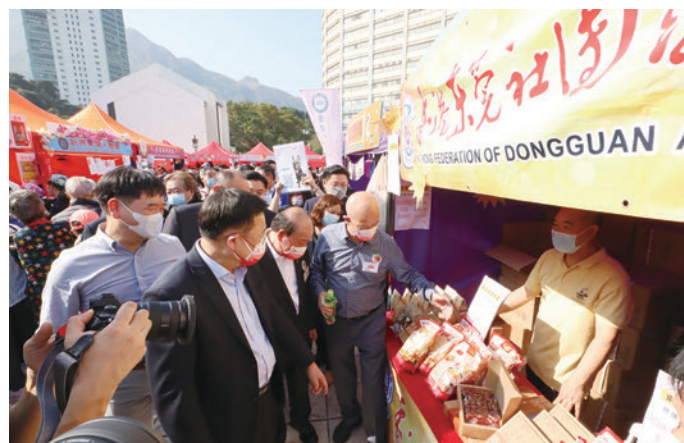
◆廣總首長陪同主禮嘉賓參觀展覽攤位。