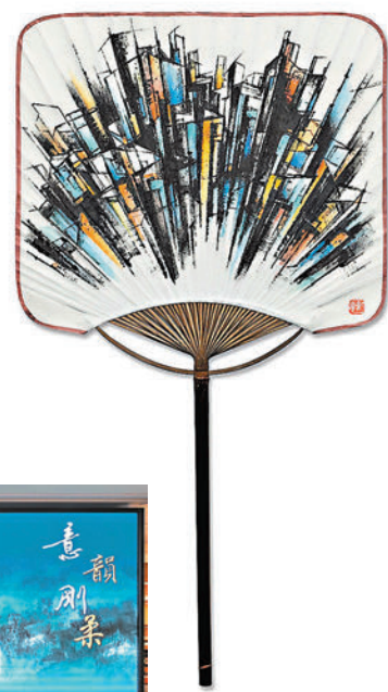
◆何百里、何紀嵐《香港格式—扇2》