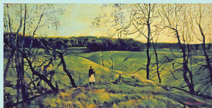
◆《克里斯帕里風景》(1974年)