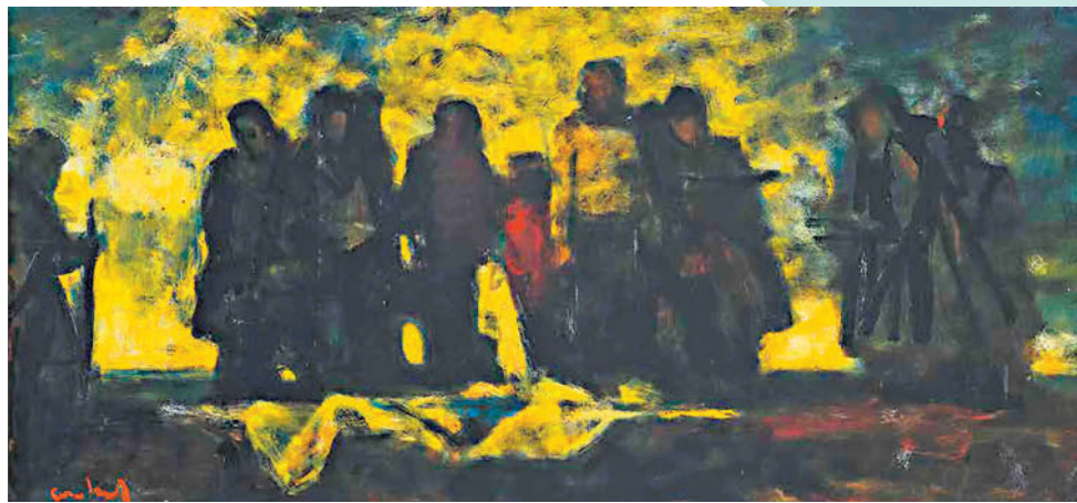
◆《波羅的海軍人的誓言》(1946年)

「梅爾尼科夫作品在中國——紀念梅爾尼科夫逝世十周年特展」早前在杭州全山石藝術中心啟幕，展期將持續至明年3月31日。梅爾尼科夫曾繪畫不少風景、靜物、肖像等其他體裁的作品，反映現實生活中人與自然融為一體的美感，以及生活的幸福與社會的和諧，均可在今次展覽中見到。