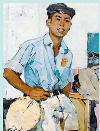
◆《中國重慶畫家肖像》(1956年)