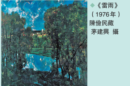
◆《雷雨》(1976年) 陳儉民藏