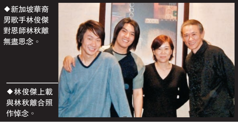
◆新加坡華裔男歌手林俊傑對恩師林秋離無盡思念。