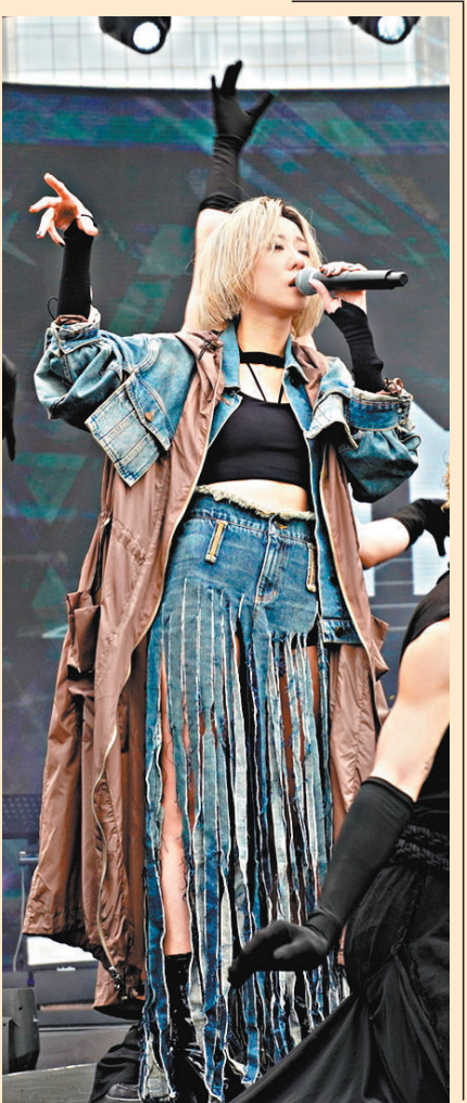
◆泳兒性感上陣，唱到第二首歌已流鼻水。