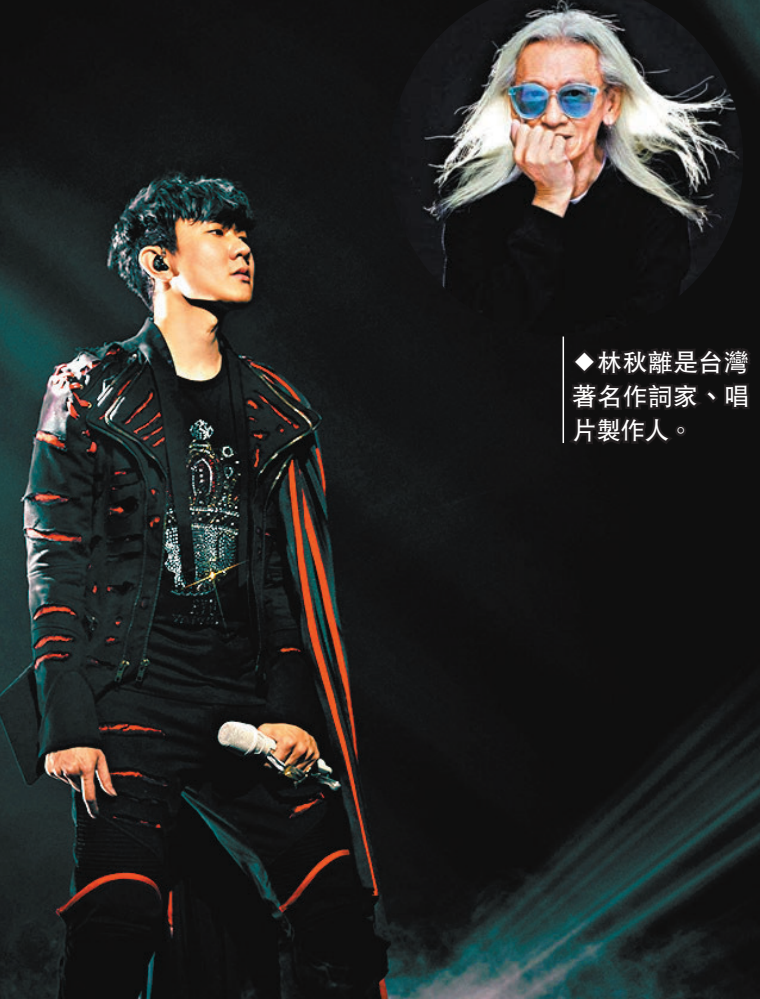
◆林秋離是台灣著名作詞家、唱片製作人。