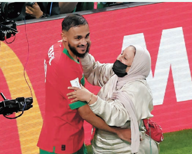
◆保法爾上仗出線後和媽媽一起慶祝。