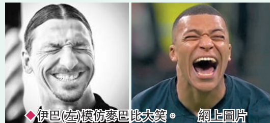
◆伊巴(左)模仿麥巴比大笑。

正當這話題熱度退減之際，瑞典名將伊巴謙莫域卻於日前上載一張笑容和麥巴比十分相似的黑白相片，並配以「未來太耀眼，我需要太陽眼鏡！」的配文，但由於「伊巴」行事出人意難以估計，故這句未來太耀眼究竟是否稱讚麥巴比，相信只有「伊巴」本人才有答案。