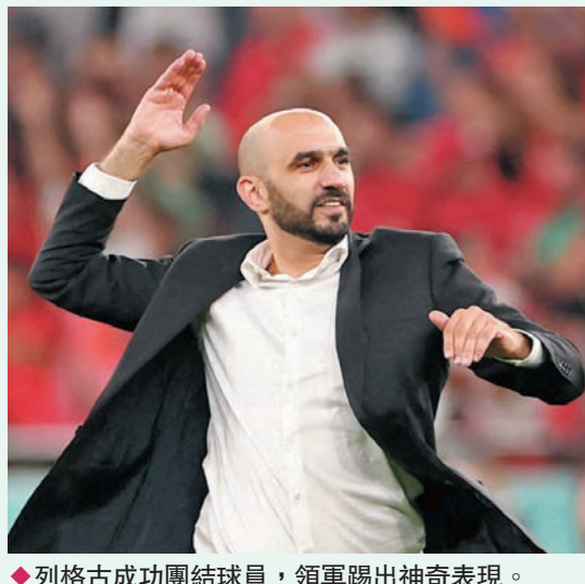
◆列格古成功團結球員，領軍踢出神奇表現。