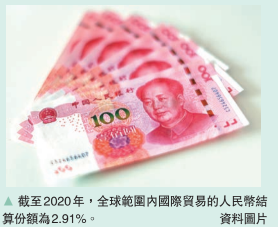
▲截至2020年，全球範圍內國際貿易的人民幣結算份額為2.91%。

報告指出，中國與阿拉伯國家的經濟結構具有很強的互補性，雙方在實體經濟合作方面有很大空間。中國是全球最大的製造業供應國，中東地區則是全球最大的石油生產地區。阿拉伯國家是中國對外承包工程重要來源地，全球綠色轉型趨勢下，新能源新基建成為中國與中東工程承包領域的新增長點。