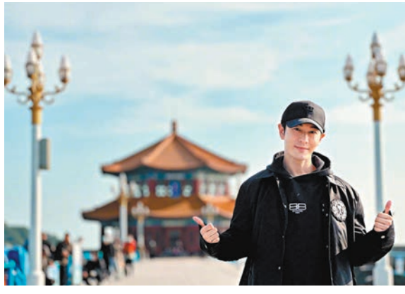
◆ 黃曉明透露睇球睇到頸痛。

香港文匯報訊（記者文芬）2022卡塔爾世界盃就像放煙花一樣，精彩紛呈，但轉眼間已進入尾聲。不少香港球迷要熬夜睇波，而內地藝人黃曉明也不例外，他還把脖子都扭痛了！ 黃曉明前日在微博發了一張阿根廷球王美斯的照片，並發文：「這幾天看球的時候突然發現自己希望那邊進球，頭就會往進攻的球門方向一偏一偏的，一場球下來脖子都扭痛了，這是什麼毛病啊，求藥方。」 最後，黃曉明也不忘向自己支持的球隊隔空打氣，「恭喜阿根廷進決賽！梅西（美斯）加油！」足見他十分關注今屆世界盃。阿根廷對法國的世界盃決賽將於香港時間星期日（18日）晚11時舉行。