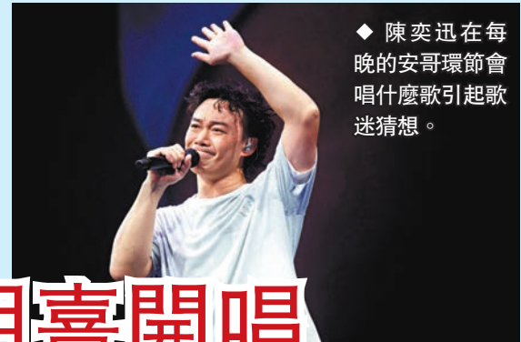
◆ 陳奕迅在每晚的安哥環節會唱什麼歌引起歌迷猜測。