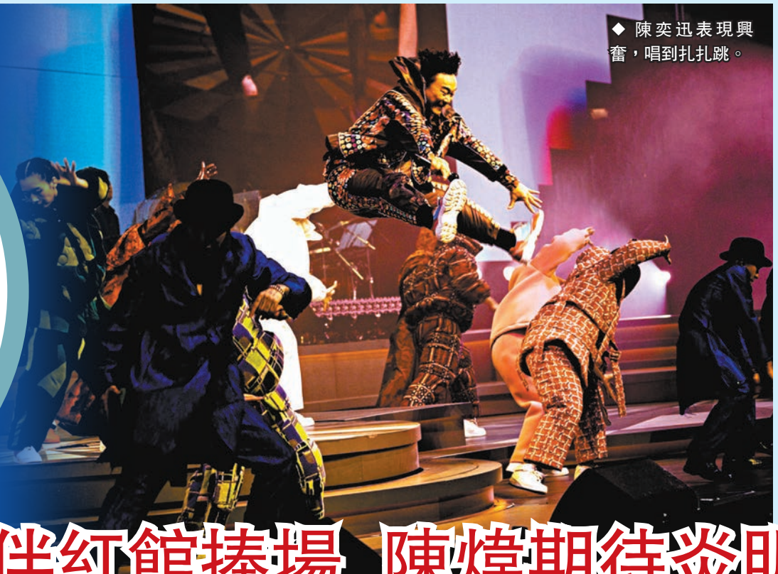
◆ 陳奕迅表現興奮，唱到扎扎跳。

香港文匯報訊（記者子棠）陳奕迅（Eason）前晚舉行的第五場演唱會，獲觀眾開電話燈滿天星海為他打氣，令Eason感動得紅着淚眼，要走回台底冷靜情緒才能繼續演唱。Eason又主動走上舞台最高位跟山頂朋友打招呼，但「落山」時險發生意外，而到了安哥環節，全場七千人一齊大合唱《K歌之王》，Eason唱了幾句已想流淚。