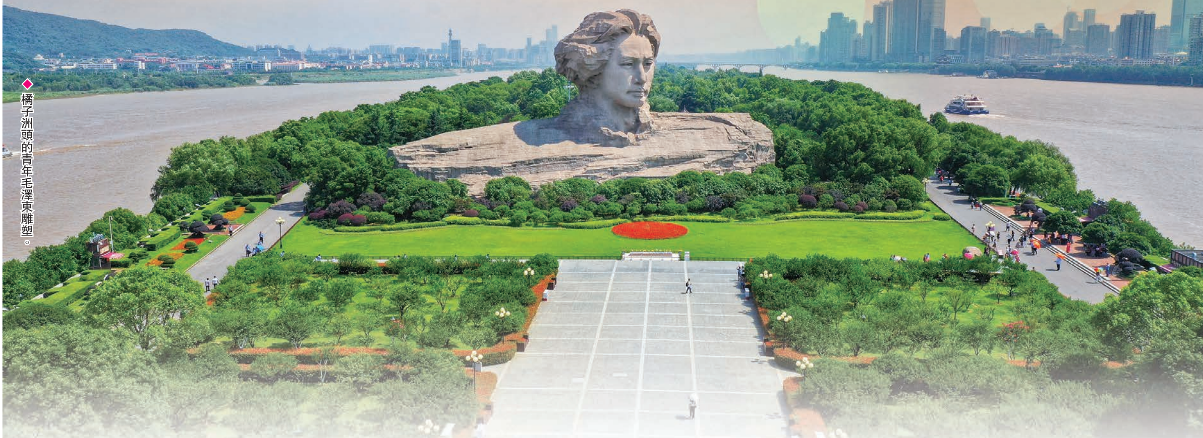
橘子洲頭的青年毛澤東雕塑。

到岳麓山頂看一場日出，在青年毛澤東雕像前拍照留影，去文和友體驗長沙特色美食，到馬欄山給自己當老闆……日前，中國社科院與教育社會學研究室課題組發布的《蹲個城市——年輕人選擇城市新需求洞察報告》數據顯示，長沙力壓一眾全國知名城市，雄踞榜首。