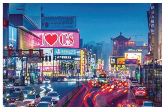
長沙五一商圈流光溢彩的夜色。

「馬欄山用心用情引才留才，為各層次人才提供了租住補貼政策『福利包』，其中對於長沙市認定的高精尖人才、緊缺急需人才和青年人才將給予2年租住全額補貼。」馬欄山人才公寓項目