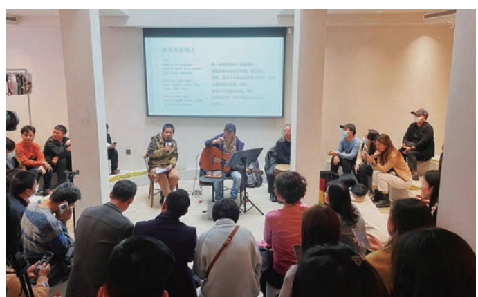
長沙「十二時辰」24小時書店，經常舉辦形式多樣的讀書會。

聽交響樂、看脫口秀、逛24小時書店……在長沙，市民的夜間文化生活越來越豐富，也讓這座喧囂的城市更有品味。