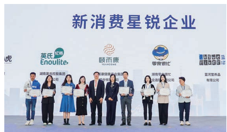
2022中國(長沙)新消費城市峰會上，為新消費星銳企業頒獎。

據統計資料顯示，2021年，長沙完成社會消費品零售總額5,111.57億元，同比增長14.4%，位居福布斯2022中國消費活力城市榜前十。從更