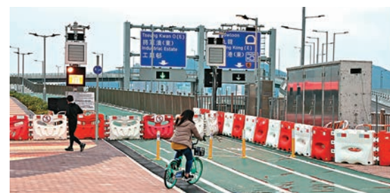
◆將軍澳跨灣大橋單車徑及行人路昨日封閉，單車友吃「閉門羹」。

天文台表示，昨晚起漸轉天晴，氣溫逐步下降，今晨市區最低氣溫約8度，新界再低幾度。日間會非常乾燥，最高氣溫約13度。吹清勁至強風程度北風，初時高地及離岸間中達烈風程度。隨後一兩日仍然寒冷。明天早上市區氣溫降至約9度，新界再低幾度，日間天晴乾燥，風勢仍然頗大。上周通車的將軍澳跨灣大橋單車徑及行人路昨日因風速過於強勁而封閉，運輸署提醒前往大橋人士改用其他單車徑及行人路前往日出康城及調景嶺。而將軍澳隧道公路則因應緊急路面維修，曾於昨日上午10時47分至11時09分封閉往將軍澳方向的管道慢線，駕駛人士只可使用其餘行車線行車，其後已解封。