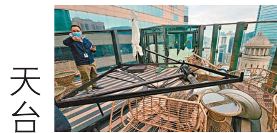
◆發生帳篷被強風吹落街的天台亦杯盤狼藉，有支架跌下，座椅翻倒。