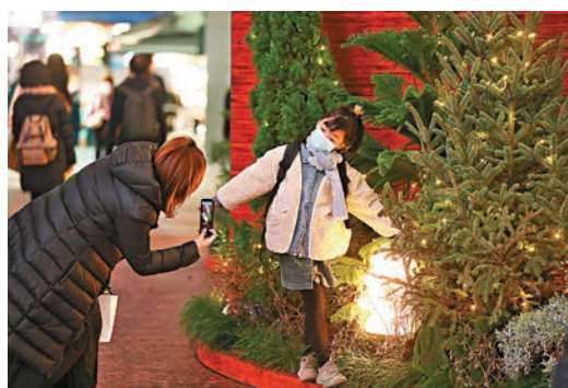
◆在寒冷天氣下，小女孩做足準備，穿上厚衣並佩戴頸巾外出。