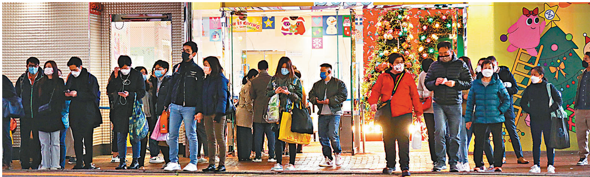
◆臨近聖誕新年，周末的香港街頭到處人山人海，不少市民冒寒冷天氣外出消遣購物。