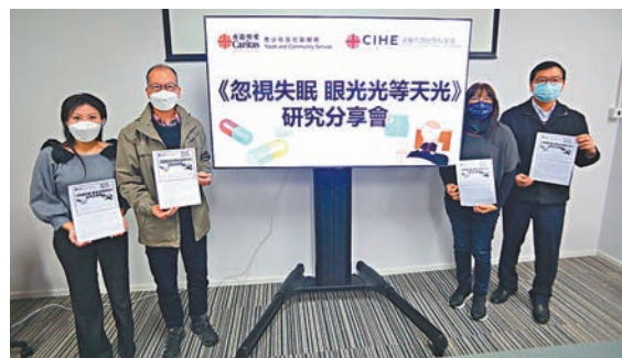
◆調查指受訪者受失眠困擾時間平均超過5年。