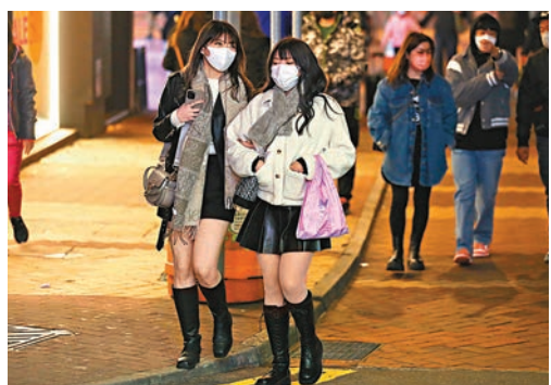
◆有少女無懼寒冷天氣，穿着短裙出街。