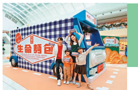
巨型生命麵包車打卡位