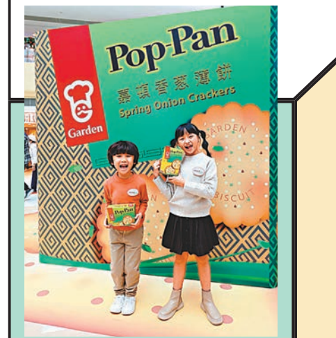
「嘉頓香葱薄餅」打卡位