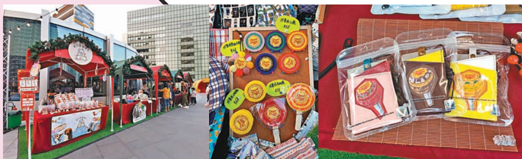
FUN享聖誕市集，你可找到一些與珍寶珠主題有關的精品。

臨近佳節，3大戶外打卡熱點壓軸登場：超過600個小燈泡打造之6米長「炫彩星光隧道」、屹立平台廣場中央的6米高「珍寶聖誕樹」、閨蜜打卡之3.5米高巨型「甜蜜滿FUN糖果罐」！還有，「FUN享聖誕市集」匯聚40個特色攤檔，逾百款聖誕主題精品、手工藝品、咖啡烘焙及珍寶珠限定商品讓大家隨意挑選。