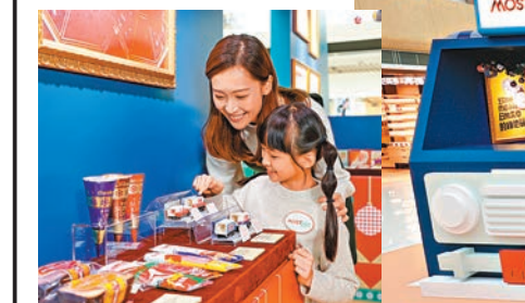
嘉頓時光穿梭展覽館