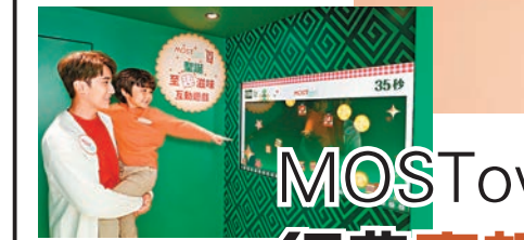
聖誕至趣滋味互動遊戲