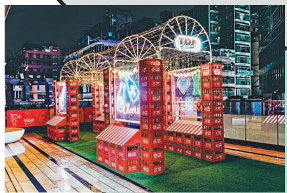
「味來見」神奇時光隧道

今年，由即日起至明年1月31日，旺角潮人集中地T.O.P This is Our Place (T.O.P) 與香港奶業界潮牌「十字牌 Trappist Dairy」攜手呈獻「T.O.P x 十字牌·想你身體健康過冬日」，打造兩大主題許願打卡勝地，包括「奶裏只得我共你」戀人小屋，以25:1比例完美放大招牌十字牌屋仔奶盒及包含百個經典牛奶箱鑲嵌設計的「味來見」神奇時光隧道。當中，位於商場1樓的戀人小屋，內裏以純白棉花及柔美吊燈營造出一片軟綿綿的雲海，適合放閃打卡中。而位於商場5樓空中花園的時光隧道，加上了浪漫又時尚的霓虹圖案裝飾，以及被繁星燈帶點綴的夜空，適合打卡許願。