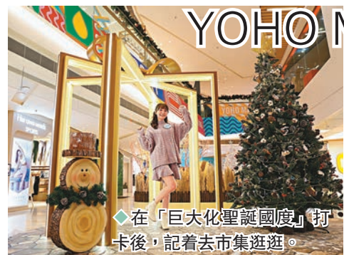
在「巨大化聖誕國慶」打卡後，記着去市集逛逛。

傳說在世界邊緣的夢幻極光擁有帶來畢生幸福的神奇魔力，可以親睹極光可算是人生願望清單的首位！由即日起至明年1月2日，YOHO MALL特別打造佔地近2,500平方呎大型聖誕主題裝置「雪影極幻森林」，並於II期中庭呈獻「雪影極幻聖誕市集」，搜羅超過20個本地人氣品牌輪流進駐，讓大家隨意挑選心儀禮物，於冬日佳節為摯愛親朋送上高心祝福！