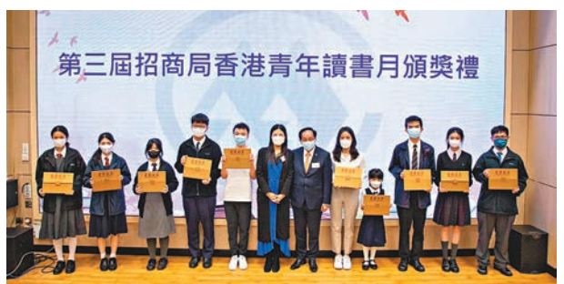
◆第三屆招商局香港青年讀書月日前舉行頒獎禮暨讀書分享會。

一家小鎮工作坊，一個平凡丹麥家族，近百年來堅持「只有最好才算夠好」的玩具理念，讓「樂高」成為世界上最受歡迎的品牌，故事及商業啟發都在這本書中。本書中，一向低調的樂高家族首次現身說法，講述樂高問世後所經歷的生產標準化與專利權、擴廠經營的資金、全球推廣、如迪士尼一樣建立附屬產業樂高樂園等問題；揭秘其管理層交班的經營管理過程；回溯樂高曾因為專利權、美國麥當勞兒童餐事件、裁員、女性職員與高層比例等問題所引發的爭議。讀者更會了解到樂高如何化解其轉型危機：電玩崛起後，樂高曾嘗試與《星際大戰》、《哈利波特》等知名IP合作，卻硬生生將企業拖至破產邊緣，有別於新聞媒體第二手資料，本書由樂高家族經營者親自說明其中內幕詳情。