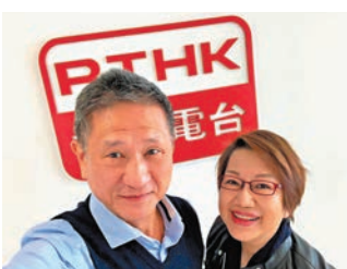
BC Lo 格言「識人好過識字」。