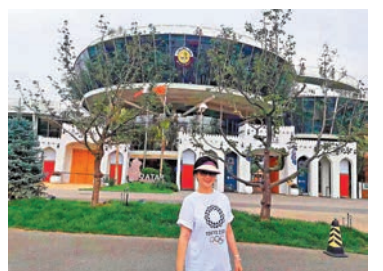
筆者2019年9月參觀北京世園會的最大外國展館——卡塔爾展館。

我對卡塔爾的首次深刻印象，是2019年9月在北京舉行的世界園藝會，參觀了當時參展的最大外國展館——卡塔爾展館。