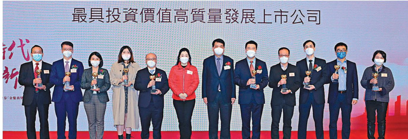
◆「金紫荊獎」昨舉行頒獎典禮。圖為得獎企業及人士接受獎項。