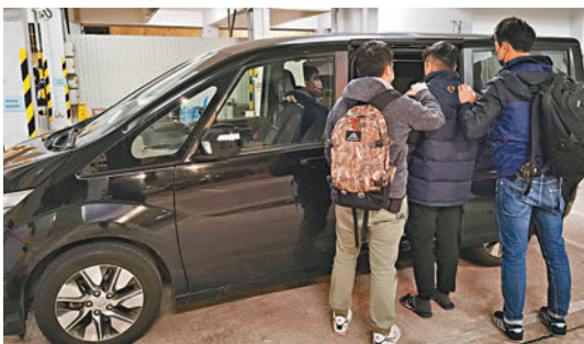
◆警方於今屆世界盃舉行期間展開多次大型反非法賭博行動，共拘捕1,104人。

香港文匯報訊（記者 蕭景源）警方於世界盃足球賽舉行期間，展開代號為「戈壁」及「風盾」的大型反非法賭博行動，搗破188個懷疑與非法賭博活動有關的處所，共拘捕1,104人，並檢獲超過5.6億元的投注紀錄及超過1,000萬元現金。