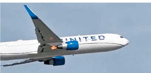
◆航機急降期間右邊引擎有火花噴出。網片截圖

民航處收到機師通報後，已即時按照既定程序處理，通知機場消防隊及機管局戒備，並安排航機於上午約11時39分安全降落。民航處在事件中沒有收到受傷報告，會與有關航空公司及其飛機註冊當局跟進事件。