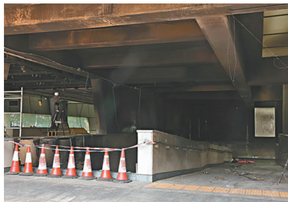
◆縱火案中，南昌站C出口及旁連行人隧道嚴重熏黑。