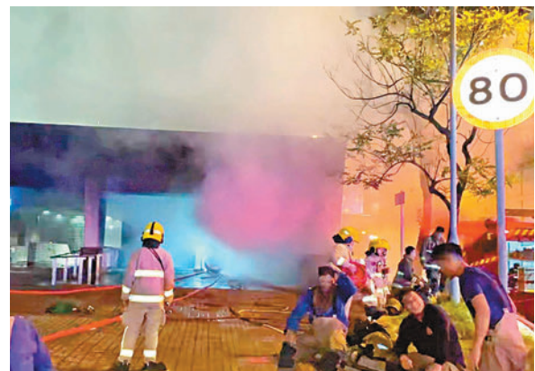
◆前晚縱火案發生期間，一度火光熊熊及不斷冒出大量濃煙。