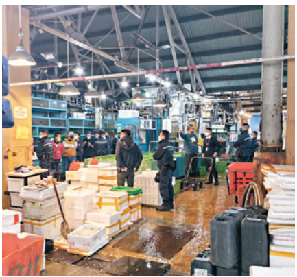
◆競委會聯同警方等多部門再到香港仔魚類批發市場展開代號「白鯨」行動。

香港文匯報訊 競爭事務委員會昨日上午在警方協助下，到香港仔魚類批發市場展開代號為「白鯨」的行動，並根據法庭手令搜查市場內多個處所，包括一艘船隻。競委會指，市場內有批發商涉嫌從事合謀定價、限制產量、集體杯葛等反競爭行為，違反《競爭條例》下的「第一行為守則」。