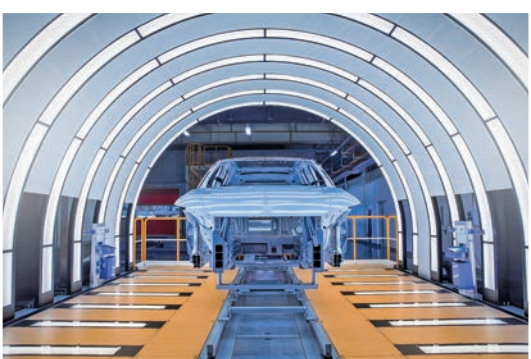
◆蔚來汽車先進製造基地

同樣落址合肥經開區，代表國產高端電動汽車參與全球競爭的蔚來汽車，也於今年7月建成投產其電驅動一期項目；9月，蔚來合肥二工廠實現量產車下線；12月12日，蔚來第30萬台量產車正式下線。這個成立於2014年的國產新興智能電動汽車品牌，正在通過不斷提高智能電動汽車的性能