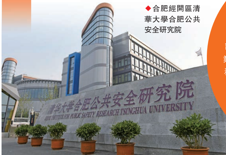
◆合肥經開區清華大學合肥公共安全研究院

自2012年以來，合肥經開區生產總值保持年均增長11.1%，連跨七個百億元（人民幣，下同）台階。據國家商務部今年1月公布的「2021年國家級經濟技術開發區綜合發展水平考核評價」結果，合肥經開區綜合發展水平躍升至全國國家級經開區中的第10位，也是中西部地區唯一進入前十強的國家級經開區。