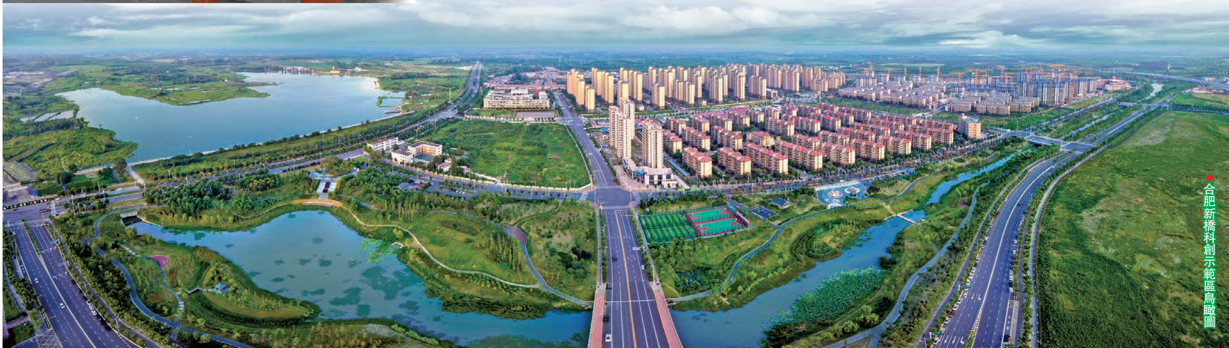
◆合肥新橋科創示範區鳥瞰圖

落實一業一證改革，首發合肥市行業綜合許可證；辦理安徽省首創合夥企業財產份額出質登記業務；深度打造「社區三公里」就業園，全省首家出台「社區三公里」就業補助政策……在合肥經開區，一項項助力企業發展的創新政策在這裏落地，一個個創優營商環境的首例在這裏發生，一大批企業在這裏迎來了發展新機遇。