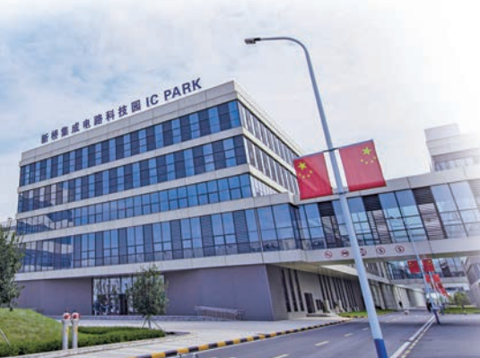
◆合肥經開區新橋集成電路科技園

在合肥經開區，像沛頓科技、悅芯科技這樣的企業還有很多。截至2022年6月，該區已集聚集成電路鏈上企業超70家，基本形成集成電路完整