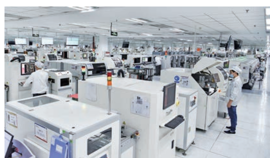
◆聯寶電子(合肥)科技有限公司內，工人輔助自動化流水線生產電腦主板。

產業鏈。2021年，該區集成電路產業實現產值114.3億元，同比增長379.9%，2022年有望突破150億元。