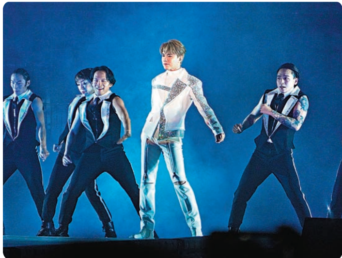
◆軒仔以跳唱形式為演唱會揭幕。

多謝大家到場支持在365日中的第27場張敬軒演唱會，亦是會員專場，有些歌只會在這晚專場演唱。我的會員好好，不會硬銷要人購物，多謝粉絲過去一年的『課金』，但由於每位歌迷只得一張『獨家村』座位，睇下會唔會一個人來、兩個人走，並且單身嘅人唔該舉手，我想睇吓有冇唱我嘅。」此言一出立即引得台下叫聲震天，也有粉絲趁機送禮物，當中有花花氣球、附有兩個包包及印上「大精寵、精精日上」字的巨型蒸籠，被軒仔笑罵「百厭」。