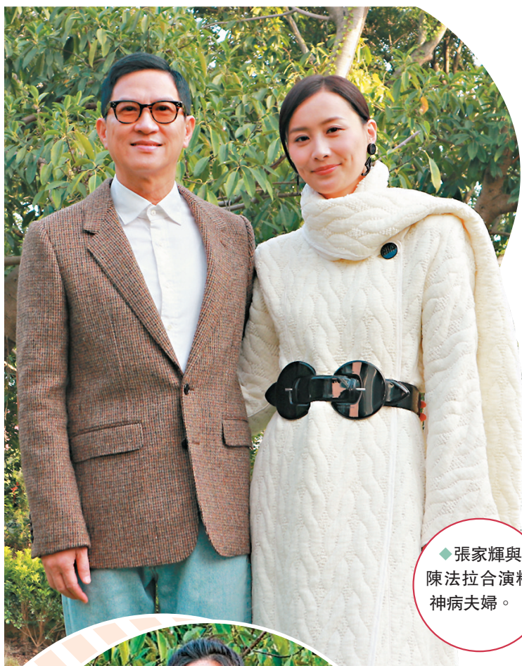
◆張家輝與陳法拉合演精神病夫婦。