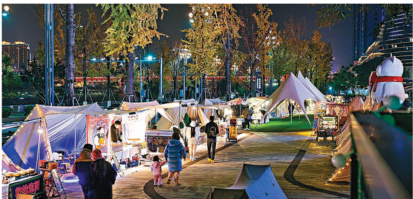
◆12月14日晚，重慶市民在位於南岸區南濱路的小熊集市上遊玩。當日，隨着復工復產復市持續推進，重慶南岸區的彩虹集市、小熊集市等多個夜間集市正式復市，城市的「煙火氣」也逐漸回歸。

會議指出，今年新增城鎮就業1,200萬人，但當前穩就業壓力依然較大，要進一步抓實穩就業保民生。一是突出保市場主體穩就業，落實好助企紓困、穩崗拓崗各項舉措。二是紮實做好大學畢業生就業工作。三是集中整頓拖欠農民工工資問題，幫助農民工節後及時返崗。四是支持以創業帶就業。五是做好困難群眾生活保障，該擴圍的擴圍，及時足額發放低保等各類救助金。六是對因疫困難群眾予以臨時救助，情況緊急的先行救助，戶籍不在本地的由急難發生地直接救助。切實保障受災困難群眾基本生活。會議研究了其他事項。