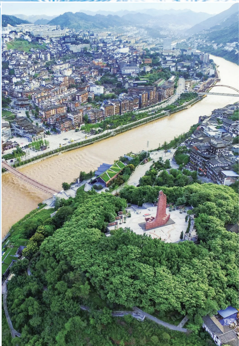
◆ 四渡赤水紀念塔。

（1413年），中國第十三個行省貴州，以其「西南胸腹」的樞紐地位，在華夏歷史的大舞台上閃亮登場。明朝屯軍貴州的第一站，就是隆里。來自中原的移民，讓隆里成為了黔東南的漢族文化區，與當地苗侗文化相合，形成了氣質別具一格的文化秘境。 古代貴州最為核心的交通要道滇黔大道，成為了這種文化交流的主動脈。它起自湖南常德，沿沅江而上進入貴州，然後東西橫跨貴州的施秉、貴定、貴陽、安順等地進入雲南，並沿南北散開，是水陸航道的綜合交通體系，也是貴州的重要人文通道。在貴州悟出了「知行合一」的王陽明，同樣由此進入貴州。 在修文龍場，就可以探訪王陽明悟道的巖洞，彷彿看到他如何逃脫追殺，一步步自滇黔大道，走過玉屏、鎮遠、施秉、凱里、龍里……踏出今天的「陽明二境」，終於在萬山叢棘中的龍場，呼喚出那句至今為中國人所沉吟的頓悟——此心俱足，不假外求！ 除了開創心學，留下諸多名篇之外，王陽明還在貴陽、修文等多地講學。後世的「黔中王門」學人，更開拓了多所貴州書院。貴州文教大興，由此而始。