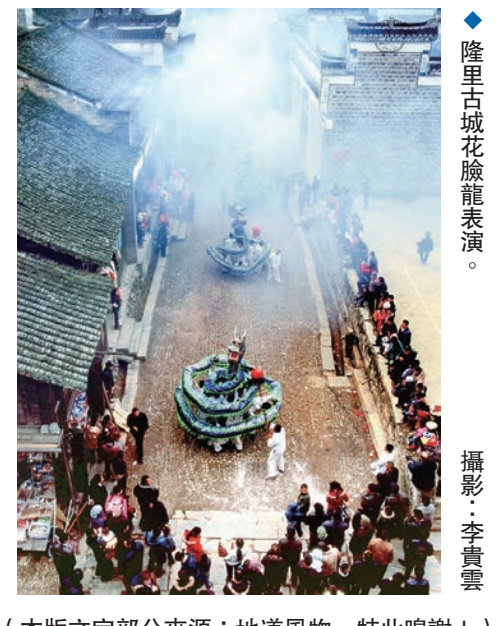
◆ 隆里古城花臉龍表演。