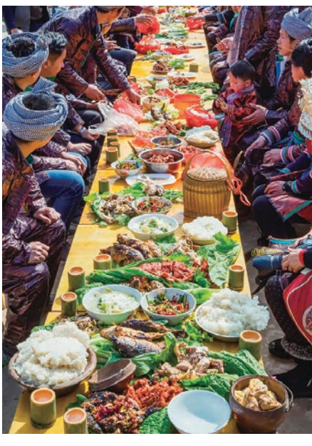
◆ 黔東南州黎平縣苗族過新年長桌宴。

立功奇，更留下那句著名的「破山中賊易，破心中賊難」。他用43天便成功鎮壓一場波及江西、安徽兩省的寧王朱宸濠叛亂，迎來人生的高光時刻。都說「李廣難封」，王陽明卻能憑借戰功被封伯爵，歷史上實為罕見。 論言，王陽明沿着「知行合一」開創的心學，在此後幾百年產生重要影響。作為「王學」的起點與發揚光大之地，貴州也從文化邊緣的邊疆省份，漸漸成為文教興盛之地。至今，貴州龍場都是中外學術界的「王學聖地」。 龍場悟道之後，王陽明在修文龍岡書院、貴陽文明書院等地授徒、講學，扭轉了貴州的學風與民風，使貴州文教大興、人才薈起。至今，位於貴陽陽明祠的陽明書院，仍然是貴州文化景觀的精髓。 近代以來，王陽明在東亞地區的影響力更甚。從開國領袖，到商界大佬，許多都是「王學」的粉絲，比如孫中山、梁啟超、稻盛和夫，都將王陽明奉為「精神偶像」。 明清之後的貴州，也迎來人才輩出的時代。繼黔北沙灘文化興起之後，貴州的詩詞文化逐漸達到頂峰，名徹全國。清朝以來，貴州人出版的個人詩集，就有百卷之多，詩風獨特的鄭珍和莫友芝，更被稱為「西南巨儒」，可謂「清詩三百年，王氣在夜郎」。文化韻味，正是漫遊貴州，理解貴州的風情密碼。