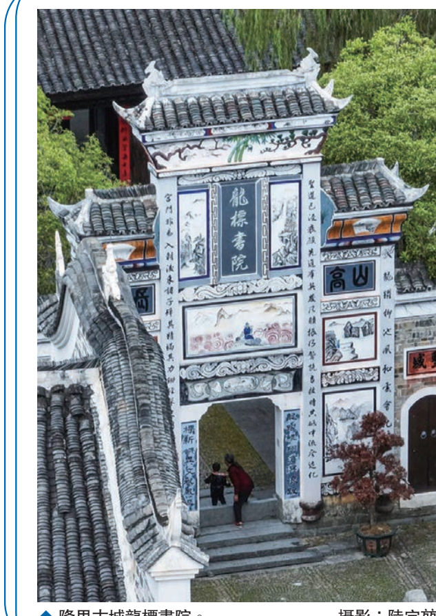
◆ 隆里古城龍標書院。

崇山峻嶺？ 而這只是貴州紅色傳承的縮影。遵義、黎平、甕安……紅軍的足跡遍布貴州的60多個縣（市、區），讓貴州成為紅軍長征途中活動時間最長、活動範圍最廣的省份。今天的貴州，也當仁不讓地成為「長征國家文化公園」的重點建設省份之一。 這種精神，也始終在貴州人的步伐之間經久不息。從革命年代到當下的「黃金十年」，貴州的變化可以說是「開天闢地」——舉行了著名的「苟壩會議」的苟壩村，隔壁就是花茂村。過去，花茂村是「外面風有多大，裏面風就有多大」的「荒茅之地」；如今，則因繁華似錦，成為了火出圈的「風景打卡點」。 黔東南台江縣，則以一場數萬人參與的「村BA」籃球賽，一夜之間火爆大江南北，就連姚明也想要親臨現場體驗，甚至驚歎道：「從場面上來看一票難求，我不確定我能拿到票。」 過去，貴州隱秀於千山萬壑之中；如今，她以明珠之姿點燃了冬季的光熱。「一村一地」皆有的生活變化，冬日溫泉裏蒸騰的溫暖，高原雪場上的天地偉觀，夜生活裏滾滾的煙火氣，才是貴州四季生活的熱烈，是貴州作為冬日寶藏大省的最好寫照。