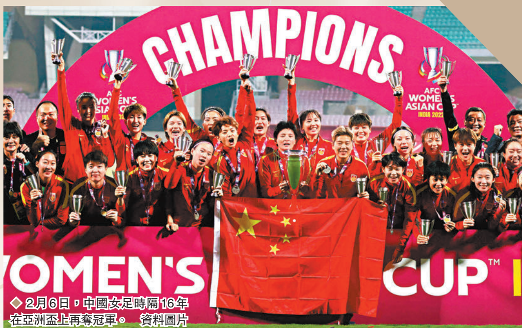
◆2月6日，中國女足時隔16年在亞洲盃上再奪冠軍。

《人民日報》這樣評價女足奪冠：「『水』到渠成的背後，是教練組指揮若定，是女足姑娘永不放棄。沒有頑強拚搏，就沒有一次次逆風翻盤；沒有咬牙堅持，也不可能笑到最後。風雨之後見彩虹，鏗鏘玫瑰已綻放，向中國女足致敬！」