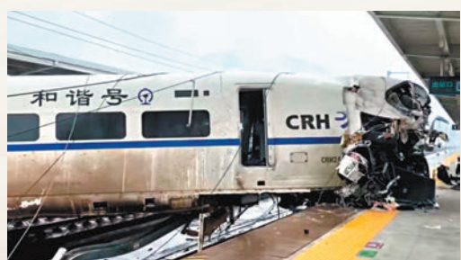
◀ 6月4日，貴陽北至廣州的D2809次旅客列車在貴州榕江站撞上泥石流脫線。