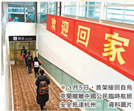
◆3月5日，首架接回自烏克蘭撤離中國公民臨時航班安全抵達杭州。

回憶起那一刻，他很激動：「我站在奧運會的升旗台，心中滿滿的自豪感，想到祖國如今的繁榮昌盛，是多麼來之不易，那是一種說不出的驕傲與熱愛，淚水就奪眶而出了……」