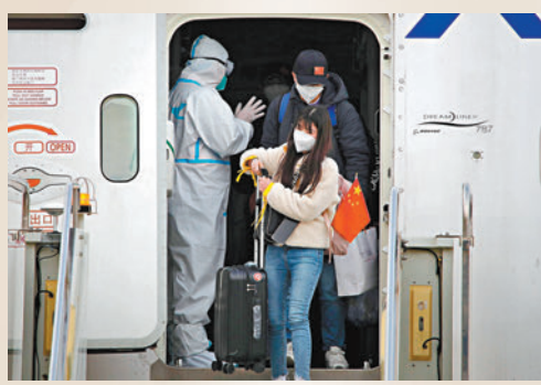
◆3月9日，由烏克蘭撤離的中國公民乘坐臨時航班抵達蘭州中川國際機場。