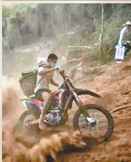
◀ 重慶摩托騎士創下救火奇跡。

由於運輸車輛無法駛入，只有摩托車可以進山，於是整個山城的摩托車彷彿都被動員了起來。有做生意的商販，有摩的師傅，甚至還有平時炫耀車技的年輕人，他們騎着摩托車帶着各種物資前往火災現場。為了與山火賽跑，騎士們連續作戰，不曾睡過一個囫圇覺。正是這些自發集結的摩托騎士，讓人們看到了中國人的善良與勇敢。