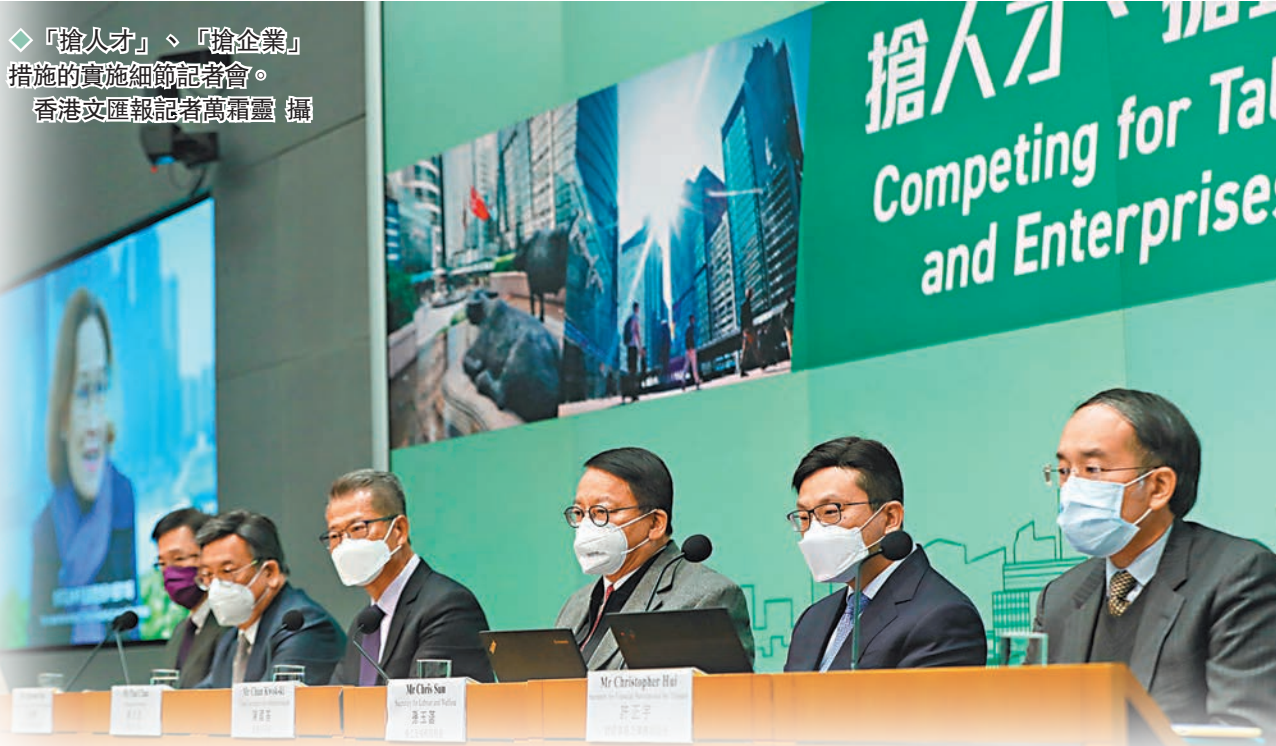
◆「搶人才」、「搶企業」措施的實施細節記者會。

香港特區行政長官李家超在施政報告中提出要「搶人才」及「搶企業」，政務司司長陳國基昨日聯同財政司司長陳茂波及相關決策局局長宣布措施詳情。在「搶人才」方面，特區政府將於下周三(28日)展開一系列「搶人才」措施。由當日開始，「高端人才通行證計劃」和經優化後的各項人才計劃將開始接受世界各地人才申請。同日，政府會推出「人才服務窗口」線上平台，並於明年年初申請撥款成立實體辦公室，又會在17個內地辦事處及海外經貿辦設「招商引才專組」，向外宣傳人才入境計劃，而各項人才計劃審批流程會加快。陳國基表示，有信心未來三年每年可吸引至少3.5萬人才來港，連同本地畢業生，可彌補過去兩年流失的約14萬人。 ◆香港文匯報記者 文森