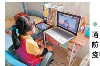
三女家悅通過Zoom訪問「青年疫行」。

正就讀香港基督教輔導學院心理輔導碩士學位，冀日後可以用專業知識和豐富經驗幫助更多的人。