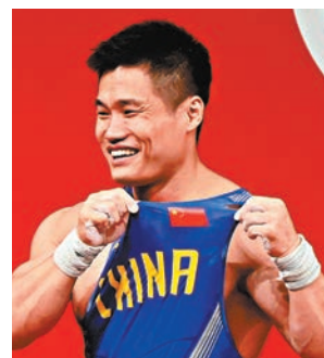
◆呂小軍在東京奧運奪金後，展示胸前的五星紅旗。

在ITA最新發布的一份公告中顯示，呂小軍在今年10月30日的賽外檢測提供的樣本中，被檢出促紅細胞生成素（EPO）。EPO被世界反興奮劑機構（WADA）列入禁用物質清單，規定運動員在賽中和賽外都不得使用該物質。EPO在醫學上可用於治療貧血，可以刺激紅細胞生成，並提升身體運輸氧氣的能力，從而增加耐力和表現。