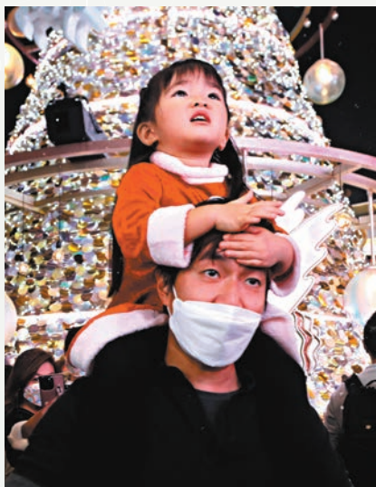
◆小朋友「騎馬」，看着漫天「飛雪」，不由張口驚嘆。