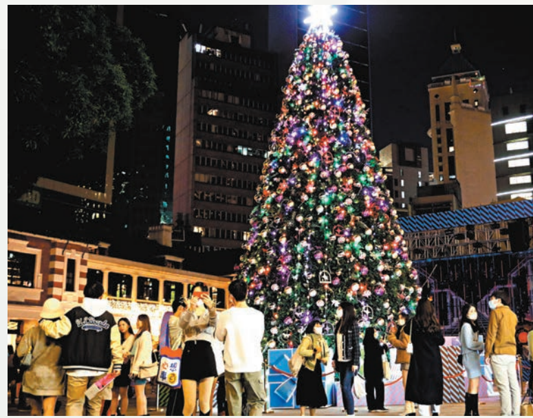
◆市民平安夜到中環大館感受節日氣氛。