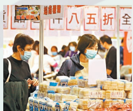
◆冬日美食節開鑼，市民入場掃貨。

另外，停辦兩屆的本地漁農美食嘉年華，會由今日起一連3天恢復實體舉行，除了本地農戶和漁戶培育的產品，由漁護署重新培育的本地米「花腰仔」首次限量發售。農業展覽區會展出可移動水耕栽培系統、智能溫室設備等現代農場科技。市民可免費入場，亦可透過網上銷售平台，由下月3日至9日購買20個漁農戶的產品。