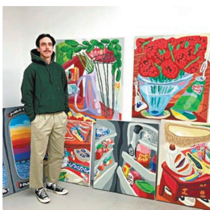
◆ 藝術家 Drew Englander

影片《楚門的世界》中，楚門以為的自己的真實生活，其實是一檔供人觀看的真人秀節目，由此引發大家對於「真實世界」的思考。WOAW 畫廊近日正舉辦一場名為《真實世界》的展覽，為駐布魯克林藝術家 Drew Englander 的首場香港個展，呈現藝術家十二幅作品，這些配色大膽、透視扭曲、充滿現實細節的畫作，正反映着藝術家的私人世界。