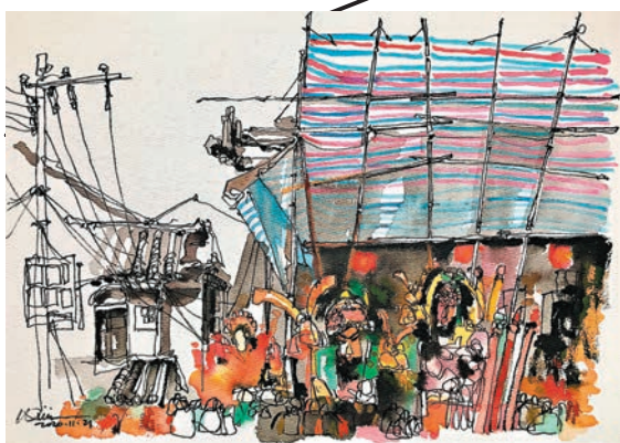
◆ 岑延威《離島神功戲棚》