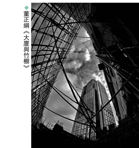
◆ 董正綱《大廈與竹棚》