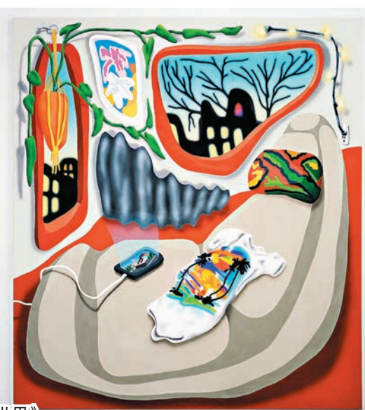
◆ California Dreaming, 2022

展覽：Drew Englander 個展《真實世界》 展期：即日起至 2023 年 1 月 10 日 地點：香港灣仔日街 5 號 Woaw Gallery