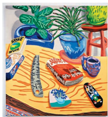
◆ House Party II, 2022