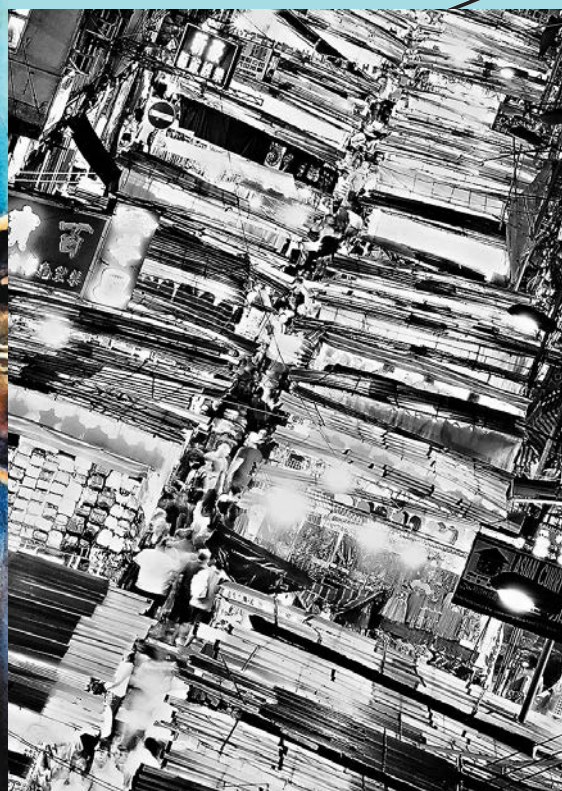
◆ 董正綱《Night Market》