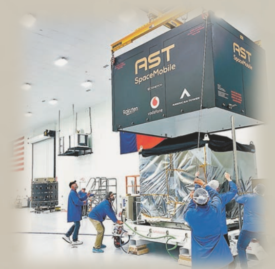
AST SpaceMobile建設低軌衛星通訊網絡，目標是讓手機可以直接連接衛星。網上圖片

偏遠地區收不到訊號的問題。現時主要電訊商AT&T和Vodafone都已經與AST SpaceMobile合作。