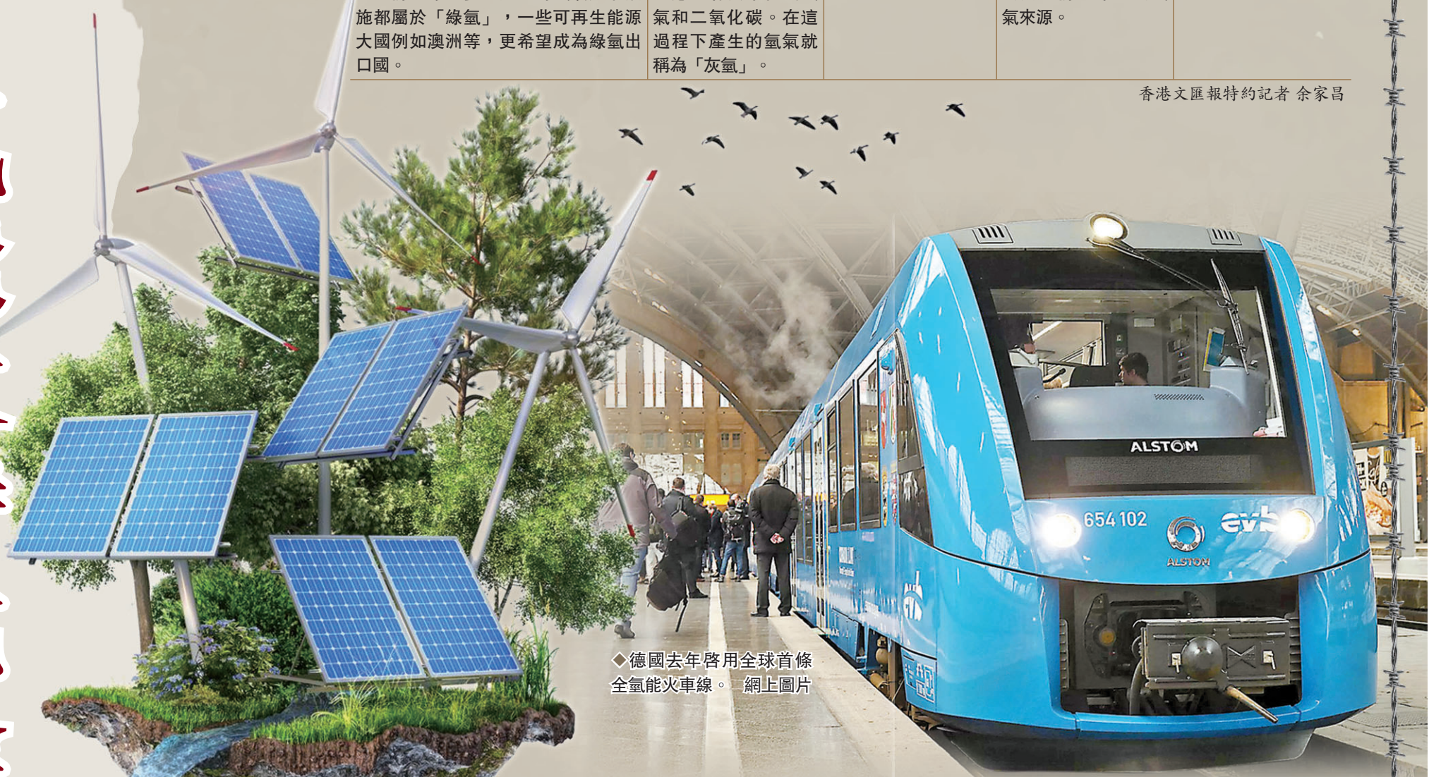
德國去年啓用全球首條全氫能火車線。