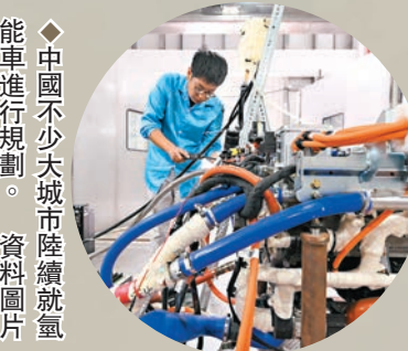
中國不少大城市陸續就氫能車進行規劃。資料圖片

分析相信，在全球各地政府大力推動、低碳減碳需求增加、技術日趨成熟等因素下，氫能市場在2023年預料將會迎來爆炸性增長。在核聚變的遠水未能救近火前，明年或者應該更關注氫能的發展。