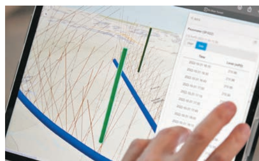
◆在新系統下，工程人員可隨時了解局部位置的水位變化。

他舉例指，泥石壩一般位於天然河道或山坡，堆積在泥石壩後方的泥石難以被察覺。有見及此，該處研發了「智能泥石壩」系統，運用物聯網科技全天候監察泥石壩，「我們在泥石壩後面安裝攝影機、深度計、撞擊感應器等，當有山泥塌下，傳感器會透過流動應用程式向工程人員發出警報，人員亦可開