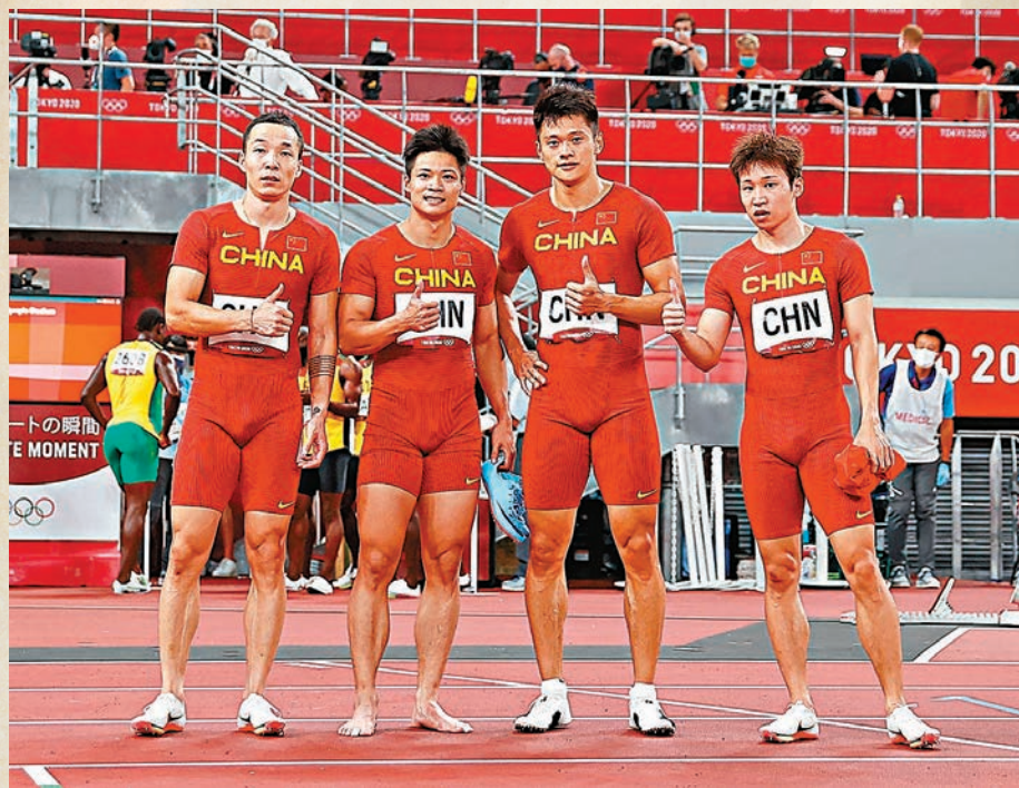
◆吳智強(左起)、蘇炳添、謝震業和湯星強終如願獲得奧運獎牌。資料圖片

此外，在3月4日至13日，北京2022年冬殘奧會亦順利舉行。中國體育代表團更以18枚金牌、61枚獎牌，名列金牌榜和獎牌榜首位，創造參加冬殘奧會歷史最好成績。