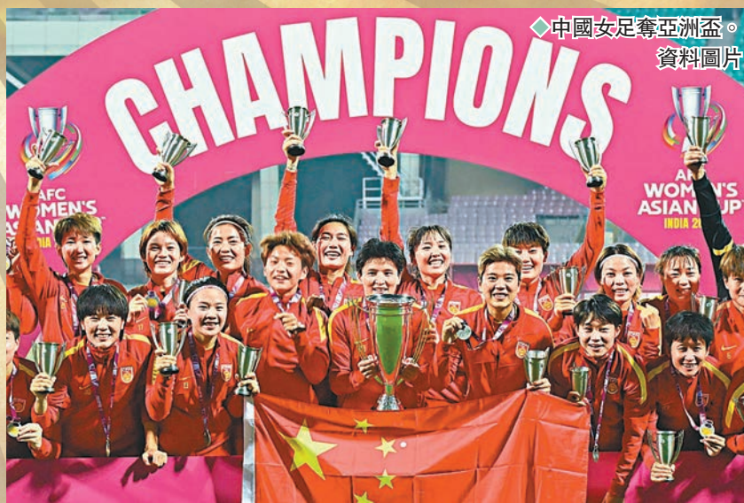
◆中國女足奪亞洲盃。資料圖片