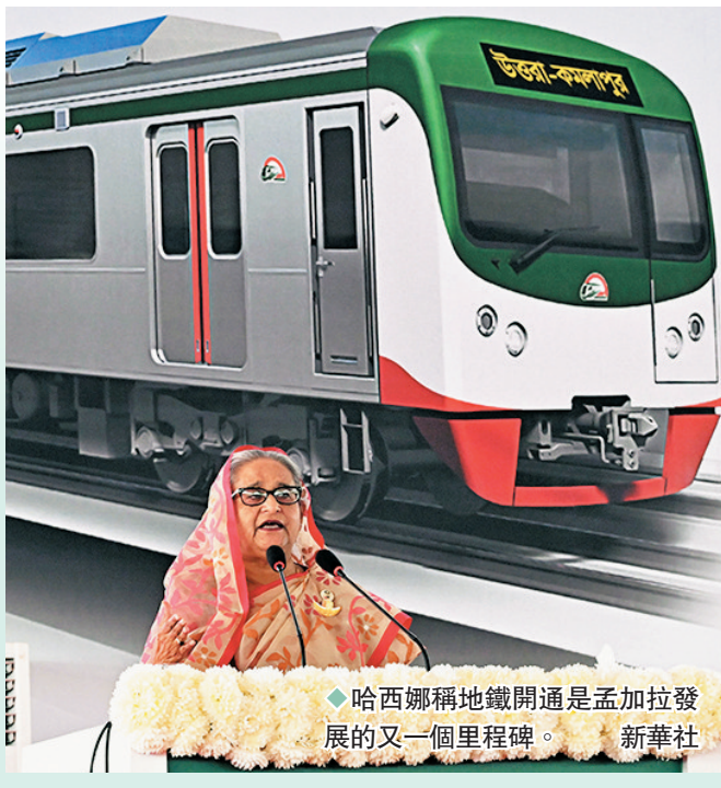
哈西娜稱地鐵開通是孟加拉發展的又一個里程碑。

根據國際註冊專業會計師協會的數據，2020年完成會計學大學學位的美國學生人數，比2012年減少近9%，降至5.25萬人，過去兩年持續下降，且更少學生完成會計師考試的4個部分測驗。