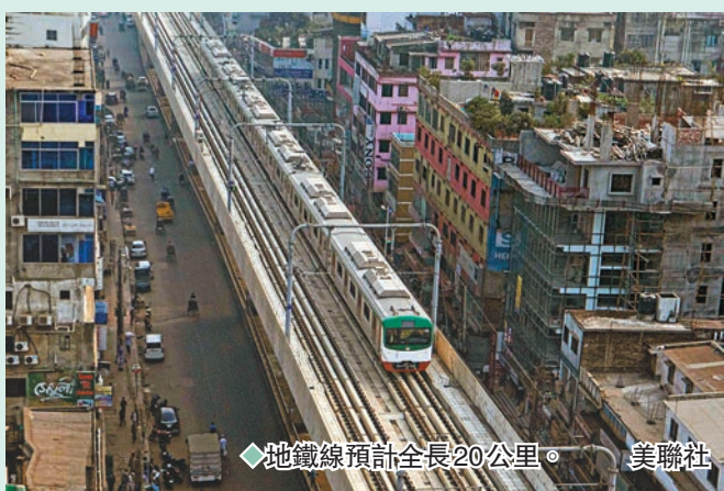
地鐵線預計全長20公里。