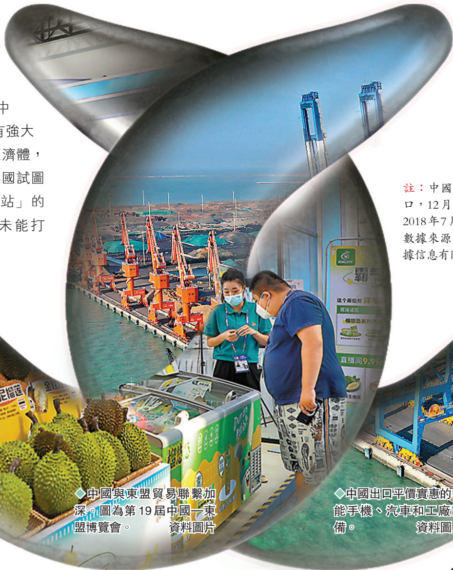
中國與東盟貿易聯繫加深。圖為第19屆中國-東盟博覽會。

美國近年不斷施壓，試圖迫使亞洲國家就貿易往來在中美之間「選邊站」。不過《華爾街日報》指出，不少亞洲經濟體近年與中國和美國的貿易額都有大幅增長，許多跨國企業也未有因生產線搬遷，便削減在華業務，這種矛盾趨勢凸顯美國對華貿易政策旨在強迫他國作出選擇的問題所在。 分析認為，由於美國針對中國產品施加高關稅，美國進口商迫切需要尋找中國製造產品的免關稅替代品，中國出口商則要在其他國設立機構，繞過美國的貿易限制，變相為許多亞洲經濟體帶來好處。華盛頓智庫「彼得森國際經濟研究所」發現在2018年後，美國進口的韓國挖土機、紡織品和電視機組件都有增加。美國海關數據也顯示自2018年7月至今，美國從東盟國家進口額增幅達89%。 報還強調，跨國企業並非因遷移生產線就退出中國市場。以蘋果公司為例，該公司近年不斷鼓勵供應商積極籌劃在亞洲其他地區，尤其在印度和越南等地組裝產品。但蘋果公司顯然沒有完全與中國脫鈎，還計劃增加與其他一些中國公司的業務往來。