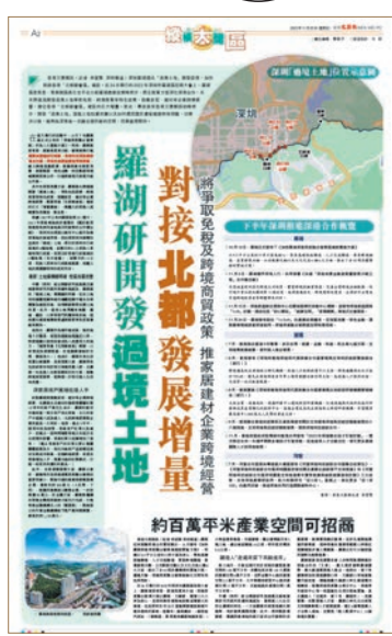
▲ 香港文匯報2022年11月25日全版報道羅湖提出「過境土地」開發設想的消息。