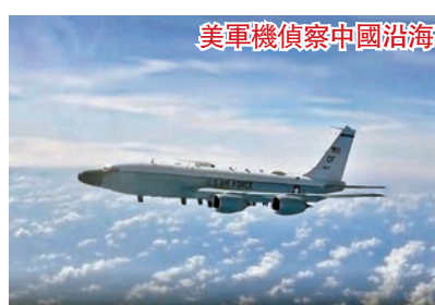
美軍機偵察中國沿海

◆美機不顧中方多次警告，突然改變飛行姿態對中方跟監飛機向左擠壓、做出危險接近動作，嚴重影響中方軍機飛行安全。