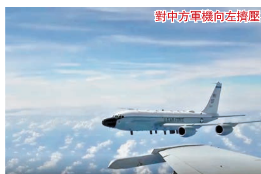
對中方軍機向左擠壓

香港文匯報訊 據中新社報道，美軍印太總部位於近日發表聲明，稱中國海軍殲-11戰鬥機對美空軍RC-135型機做出不安全飛行動作。解放軍南部戰區在2022年12月31日晚間公布一段30秒視頻，視頻記錄2022年12月21日11時25分17秒，美軍機蓄意改變飛行姿態、危險抵近解放軍戰機的過程。