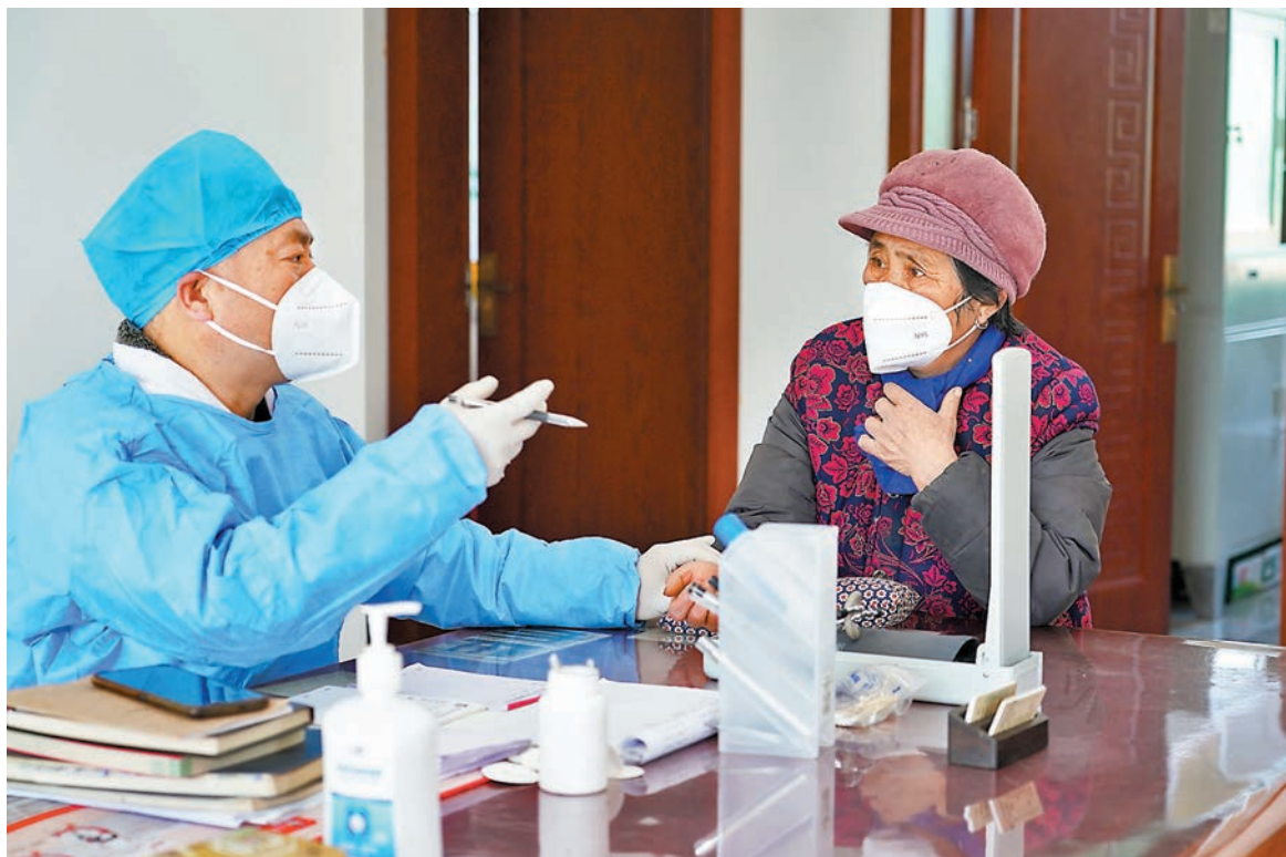
◆2022年12月22日，在陝西西安周至縣馬召鎮富饒村東富饒衛生室內，村醫在為發熱患者診療。 資料圖片

另外，還強調統籌推進農業穩產保供，包括抓實冬季蔬菜穩產保供、指導地方做好畜牧生產、保障冬春農業生產、打通堵點保障農資供應。