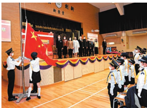
◆教聯會黃楚標中學舉行升旗儀式。