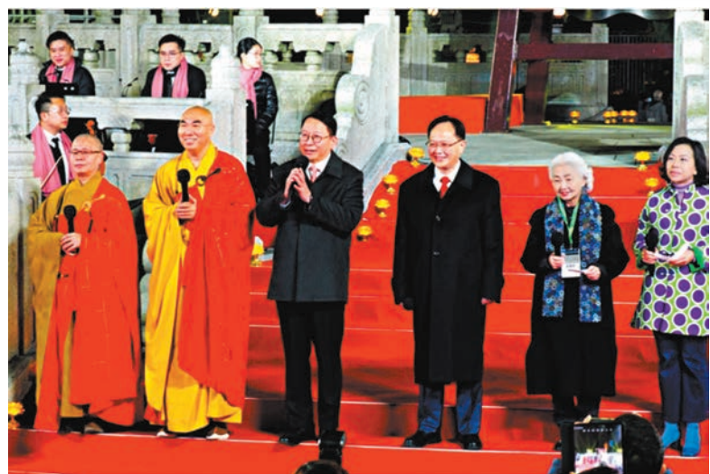
◆主禮嘉賓送上新年祝福語。

香港文匯報訊 據中聯辦網訊，「大佛鐘聲，佛佑香江——2023年元旦叩鐘祈福活動」12月31日午夜在寶蓮禪寺大佛廣場隆重舉行。香港特區政府政務司司長陳國基、香港中聯辦副主任陳冬、特區政府民政及青年事務局長麥美娟與香港佛教聯合會會長寬運法師、寶蓮禪寺方丈淨因法師，共同叩響送歲迎新鐘聲並祝祝福語。陳冬副主任代表中央政府駐港聯絡辦送上新年祝福：祝願市民朋友幸福安康！祝願香港未來風光無限！祝願偉大的祖國繁榮昌盛，國泰民安！