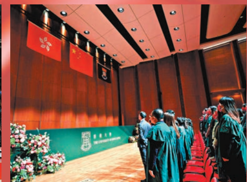
◆港大舉行升旗儀式。