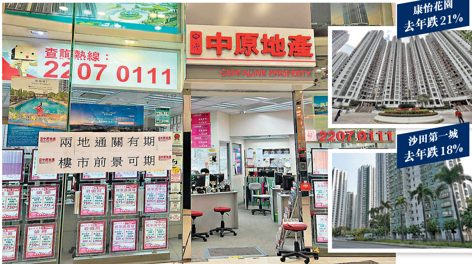
◆ 困擾本港樓市四大因素——疫情、俄烏衝突、股市下挫及加息已逐步淡化，市場看好2023年樓價止跌回升。

美國加息幅度在2023年料進一步縮減，相信加息對港樓影響會逐步淡化，按息離見頂不遠，待美國減息時，香港樓價更有可出現報復式反彈。雖料差估署去年12月份樓價指數仍會錄得跌幅，但跌幅會明顯收窄，相信2023年全年樓價將會谷底反彈15%。