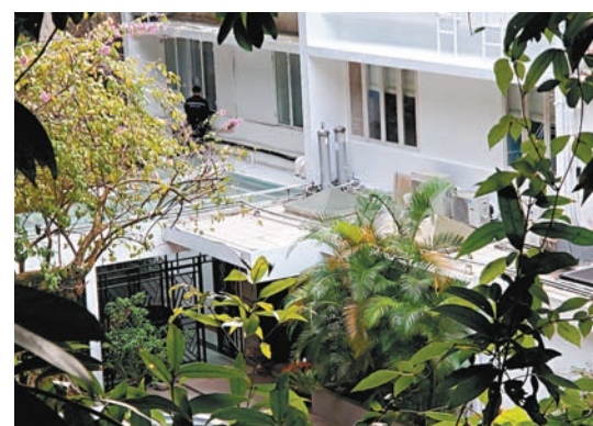
◆山頂貝璐道獨立屋遭爆竊。