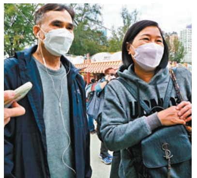
◆司徒夫婦表示，工展會的價錢和外面差不多，但是這邊選擇多，所以每年來都希望可以掃到貨。