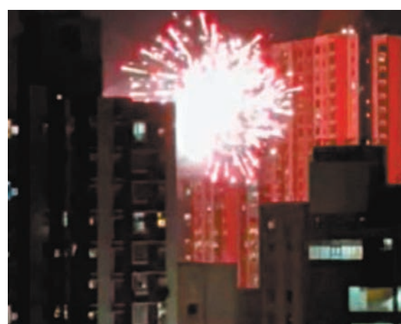
◆元朗非法燃放煙花。 網上片段截圖

仍留有不少煙花殘骸，包括一個寫有168枚煙花字樣的煙花發射器紙箱，亦有雜草被燒焦。此外，昨日凌晨在元朗區約同一時間，竟有多達5處有人燃放煙花連珠炮發，「嘸、嘸、嘸」的響聲此起彼