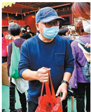
◆王先生表示，來工展會是為過年做好準備。