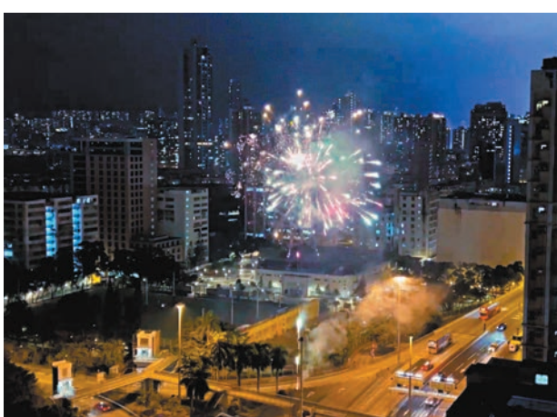
◆土瓜灣非法燃放煙花。 網上片段截圖

有關煙花的短片在上載網上討論區後，即時引起網民熱議：「不知道誰這麼沙膽，在啟德隧道土瓜灣出口放煙花」，亦有網民笑稱是「斧頭幫在召集人馬」。至昨日天光後，有傳媒到現場察看，發現地上