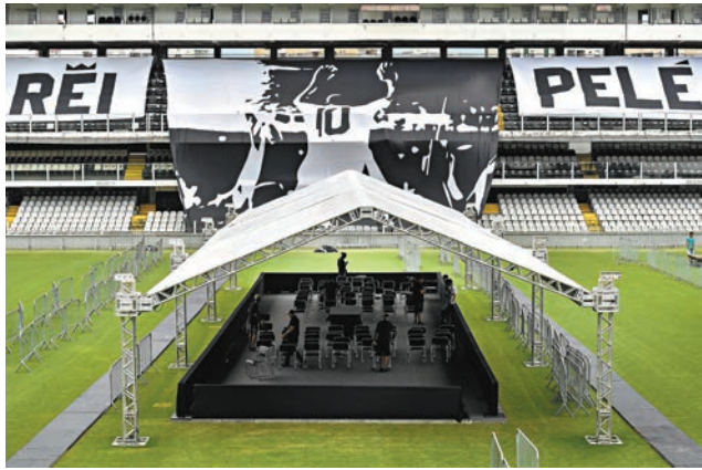
工作人員為比利的惜別會作準備。