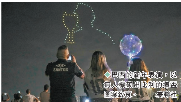
巴西的新年表演，以無人機砌出比利的捧盃圖案致敬。