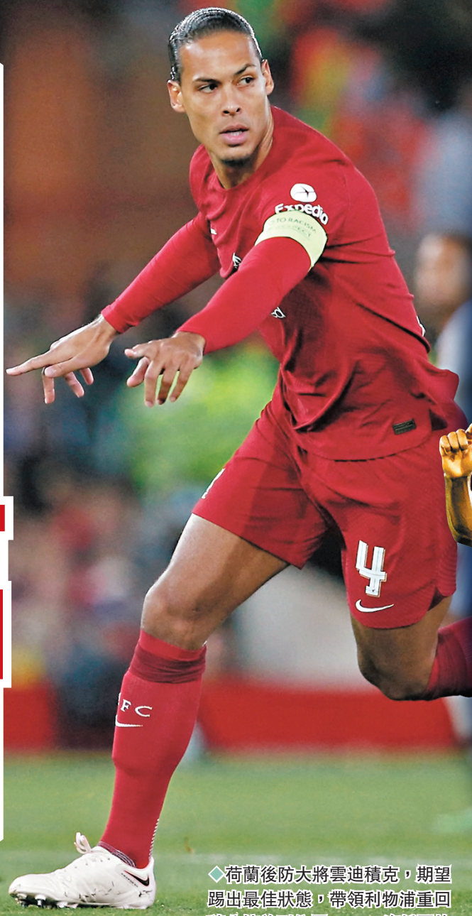
荷蘭後防將雲迪積克，期望踢出最佳狀態，帶領利物浦重回積分榜前列位置。資料圖片