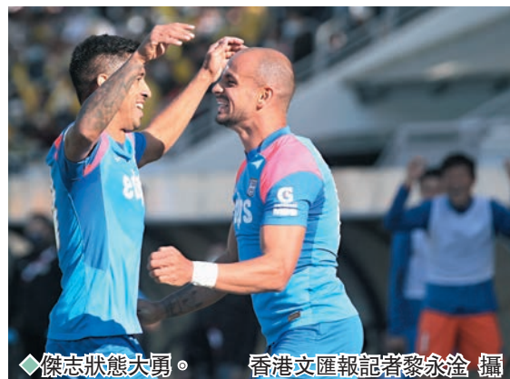
傑志狀態大勇。

而晉峰上仗正正是以1:6大敗於傑志腳下，總教練何信賢表示雙方主要分野在於把握力，相信球員汲取教訓後會有更佳演出，最重要是球隊落後下仍然竭力爭取入球未有失去鬥志，強調球隊無論面對任何對手都不會放棄爭勝。