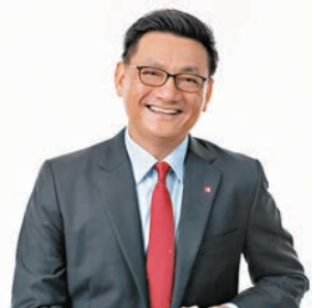
◆侯偉福認為，目前是投資者平衡投資風險的好時機。

另外，侯偉福認為美聯儲的加息步伐將會放緩，預期今年聯儲基金利率升至5%便會見頂。在加息周期下，企業融資成本上漲，但優質企業更具能力將成本轉嫁予消費者，因此該行較為看好財務實力較好，以及具規模公司的股份。