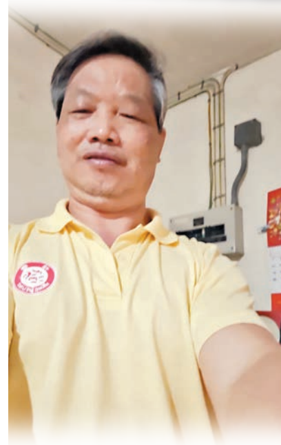
◆楊先生現在孑然一身在港工作，很期待回內地和妻兒團聚。